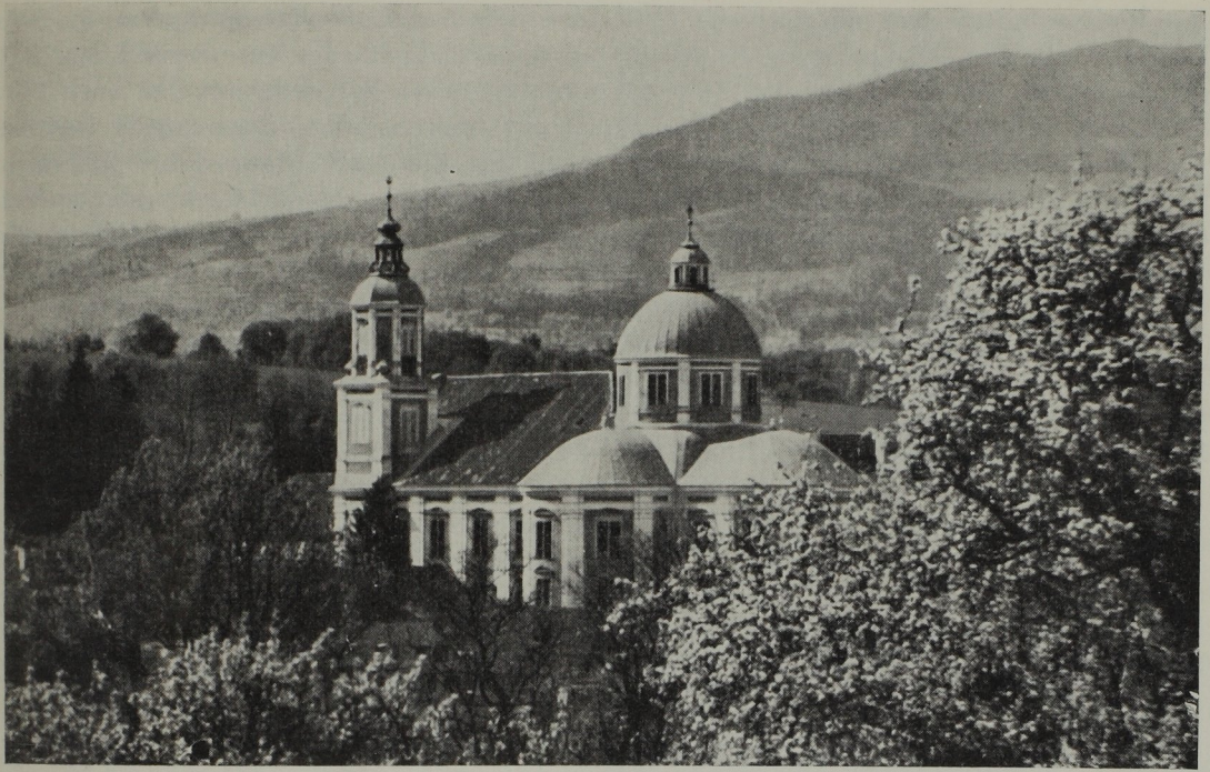
Abb. 116. Joachim Carlone: Stiftskirche Pöllau 1699—1712

berichten. Eine größere Sache — Zubau oder Reparatur? — war am Pfarrhof St. Ruprecht zu leisten, die 1686 mit 250 fl entlohnt wurde. Der Gruftbau in der Grazer Stadtpfarrkirche im Jahre 1687 kam auf 756 fl zu stehen. In diesem Jahr gab es auch einen Konkurrenzstreit mit Domenico Orsolino um eine Arbeit im Ferdinandeum, in dem scheinbar Orsolino Sieger blieb. 1689 lief bei der Hofkammer eine Beschwerde ein, daß Meister Joachim beim Grafen Wagensberg unter der Normaltaxe arbeite. In der Albrechtgasse oder Färbergasse?