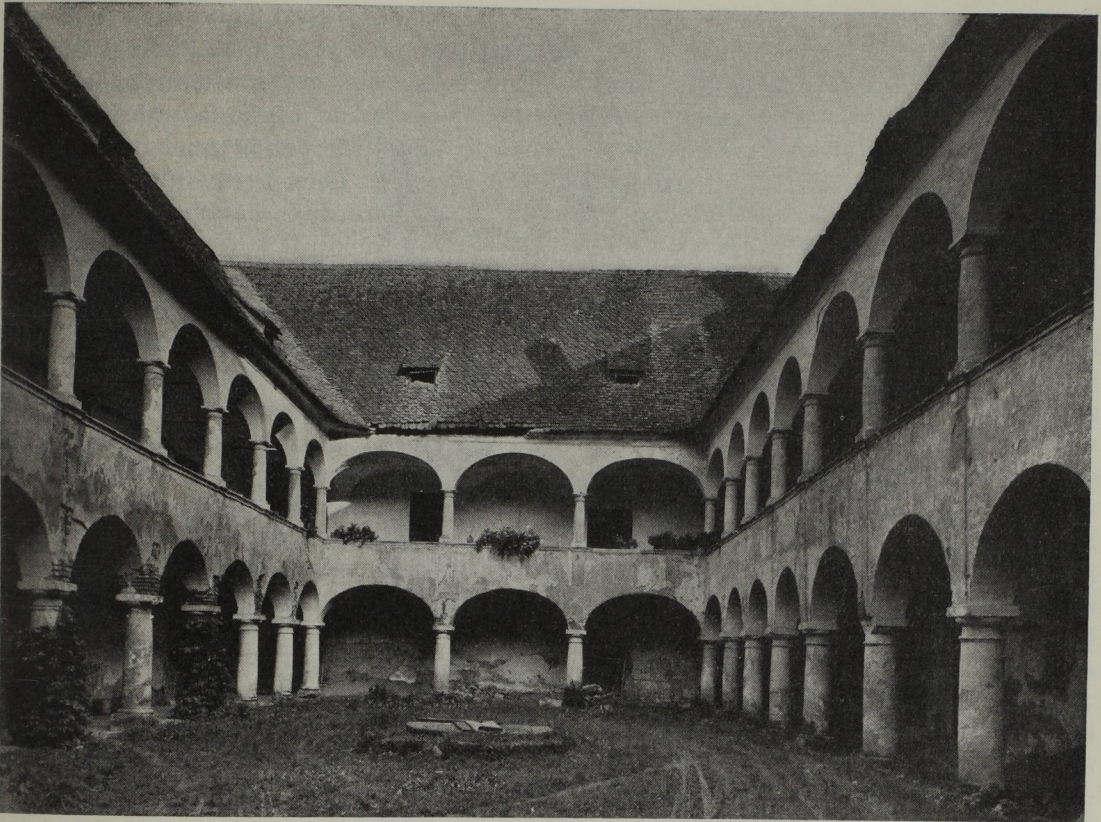
Abb. 114. Franz Isidor Carlone: Oberstock des Schlößchens Waldschach. 1668

schuf das bescheidene — Aufdingbuch. Er dinte von 1647—1684 27 Lehrlinge auf, 1663 führt er den schönen Namen „Maister Franz Issytoruuss Chrln“, am 16. August dingt er auf „sein Sohn Franz Wilhelm b“ Carlon. Als solcher wird er 1666 freigesagt und unter den Kommissären Domenico Orsolino und Simon Lanz am 6. November 1672 Meister, am 12. April 1673 schon als „Junger gesell Maister und Maurer“ in St. Andrä — begraben. Der Stadtmeister Franz Isidor Carlon aber war 1666 Land-schaftlicher Maurermeister geworden und blieb es bis zu seinem Tode, am 28. Oktober 1684 ward er zu St. Andrä begraben. Als Hausbesitzer im „Lötzten Sackh“. Das Haus trug später die Nummer Sackstraße 61, hieß schon 1658 Carlonisches Haus bei der Ba-stei. Seine Frau hieß, wie Tuschnig erhob, Katharina Eva Färy und stammte aus Wundschuh. Dort ist er jedenfalls getraut worden, die Matriken reichen leider nur bis 1688 zurück.