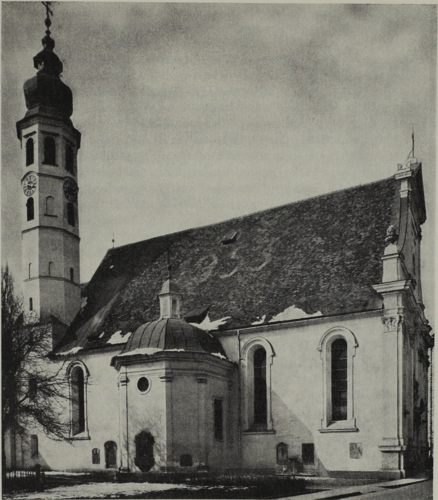
Abb. 112. Archangelo Carlone: Stadtpfarrkirche St. Andrä