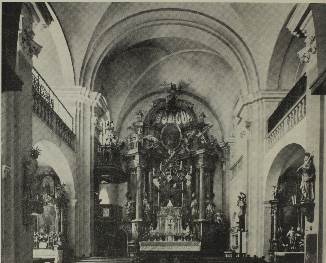
Abb. 94. Bartlme Ebner: Ursulinenkirche, 1694—1700

Bartlme Ebner zumindest mit silbernen Lettern in die steirische Kunstgeschichte eintrug, als reichbefähigten Kirchenbaumeisters, der auf diesem Gebiete vom Frühbarock zum Hochbarock hinüberreifte. Wir übergehen die zahlreichen Fälle, in denen Ebner wie etwa um 1690 in den Kirchen Straßgang, St. Florian und St. Rupert zu subalternem Dienst an Fassaden und Dächern herangezogen wurde, wir sprechen vom Kirchenarchitekten Ebner.