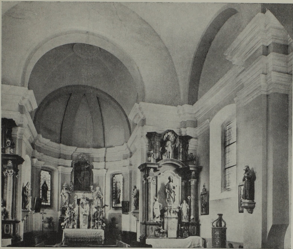
Abb. 94*. Bartlme Ebner: Pfarrkirche Blumau. Um 1702

Das Kirchenschiff von St. Nikolai — das Presbyterium wurde 1818 umgebaut — wölbt sich in verblüffend breiter Spannung von Mauer zu Mauer, hat weder Pilaster noch Stuckgesimse, weder Seitenkapellen noch Emporengänge, wirkt somit altmodisch gleich einer Tonne. Wie ganz anders die Ursulinenkirche: Ungleich höher, gegliedert, festlicher das Presbyterium (Bild 94) und Schiff (Tafel 104).