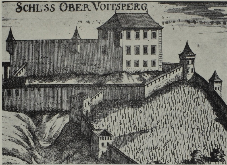
Abb. 73. „Ober Voitsperg“ in Vischers Schlösserbuch (Ausschnitt)

Einwilligung des Grundherrn Stift St. Lambrecht, das nun durch anderwärtigen Besitz entschädigt wurde, im Schlosse amtierten schon damals Vögte des Herzogs. Als 1532 wiederum die Türken in Sicht waren, wurden die Bauern zur Robot aufgeboten; in der Eile