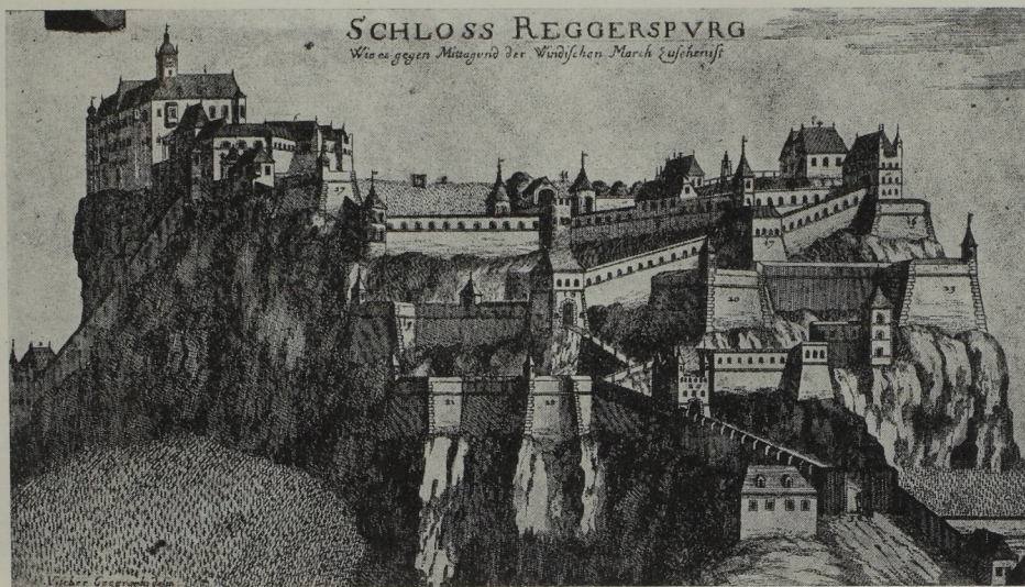
Abb. 69. Die Riegersburg in Vischers Schlösserbuch (Ausschnitt)

„Rudkerspurch“, schon 1170 genannt, ist die malerischste und gewaltigste Wehranlage des Landes, war „die stärkste Festung der Christenheit“. Auf einem an drei Seiten schroff abfallenden Felsklotz aus Basalttuff thront stolz und unnahbar Schloß Krongegg (Tafel 60), das einst am Fuß des Abhangs postierte Schloß Lichteneck ist demoliert, doch präsentieren sich hügelempor noch 7 Tore und 11 Basteien recht gut erhalten. genauer wiederhergestellt, wenn auch der imposante Anblick des Vischerischen Stiches (Abb. 69) um einige markante Blickpunkte ärmer geworden ist. Von 1301 bis 1478 eignete die Burg den Herren von Walsee. Aus dieser Zeit erhielten sich noch zwei — Baurechnungen. Ihre Originale liegen im Museumsarchiv Linz und auf Schloß Niederwalsee N.-O., ihre Abschriften in unserem Landesarchiv. Die erstere vom Jahre 1437 berichtet vom „paw des nidern Haws zu Rueckersburg“, das Fragment erwähnt leider nur die Steinbrecher Nickl und Rukhenstain, die zusammen 55 Klafter Steine brachen, die andere aber vom Jahre 1454 nennt 12 Wochen lang Meister Petter Maurer und Meister Cristan „staynmez“. Der eine arbeitete mit zwei, der andere mit drei Gesellen. Wo sie saßen, wird leider nicht gesagt. Im zweiten Fall handelte es sich möglicherweise um einen größeren Bau, weil Roboter beigezogen waren, vielleicht aber am Schloß Gleichenberg, weil der rechnungsführende Amtmann dort saß.