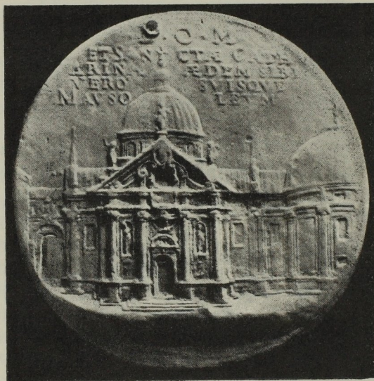
Abb. 62. Gedenkmedaille mit Entwurfrelief

In sechs Raten wurden hiefür im ersten Baujahr 11.000 fl angewiesen, am 30. Oktober auch schon ein Gnadengeld von 400 fl an den Baumeister, dazu noch am 2. November 100 Taler. Die alte schon 1325 bezugte „niedere und enge Capelln“ ward erst 1620 abgetragen, die Grabeskirche also