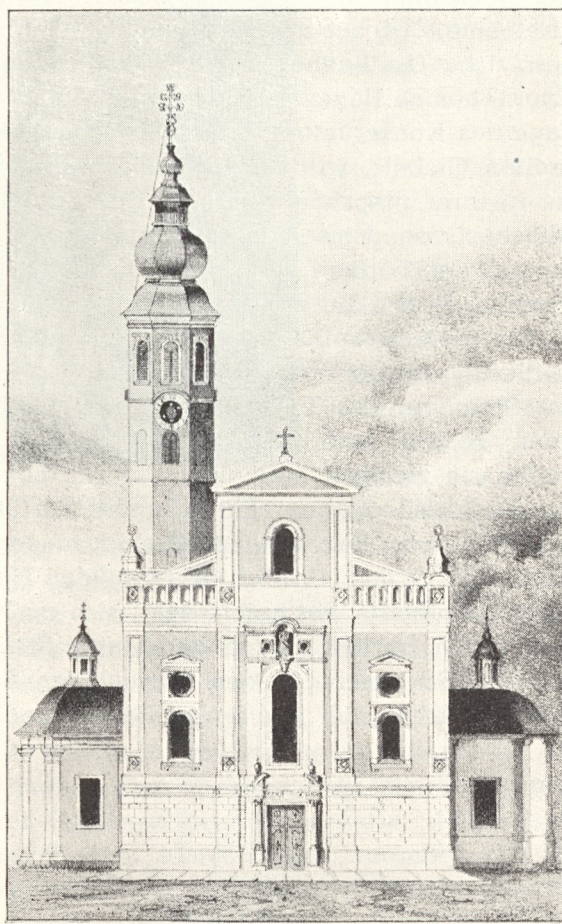
Abb. 96. Plan einer Umgestaltung