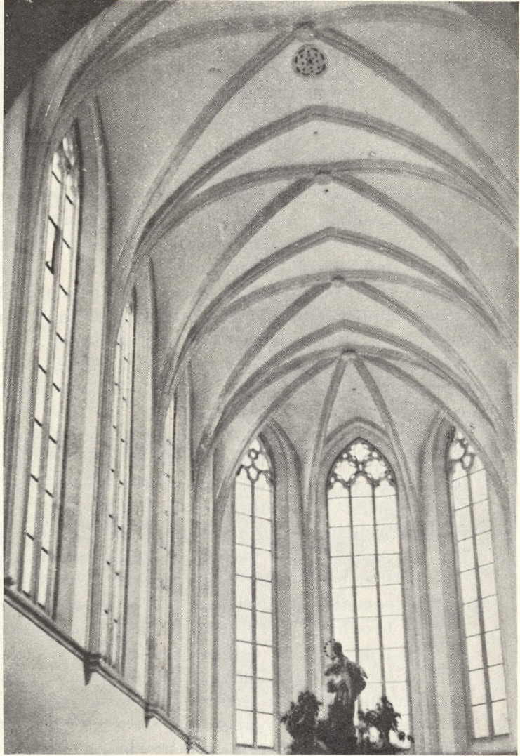
Abb. 111. Das wiederhergestellte Presbyterium