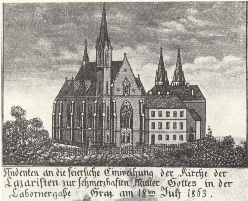
Abb. 98. Stich zur Weihefeier

Für ein Baugenie vom Range eines Friedrich Schmidt war hier freilich kein Rahmen