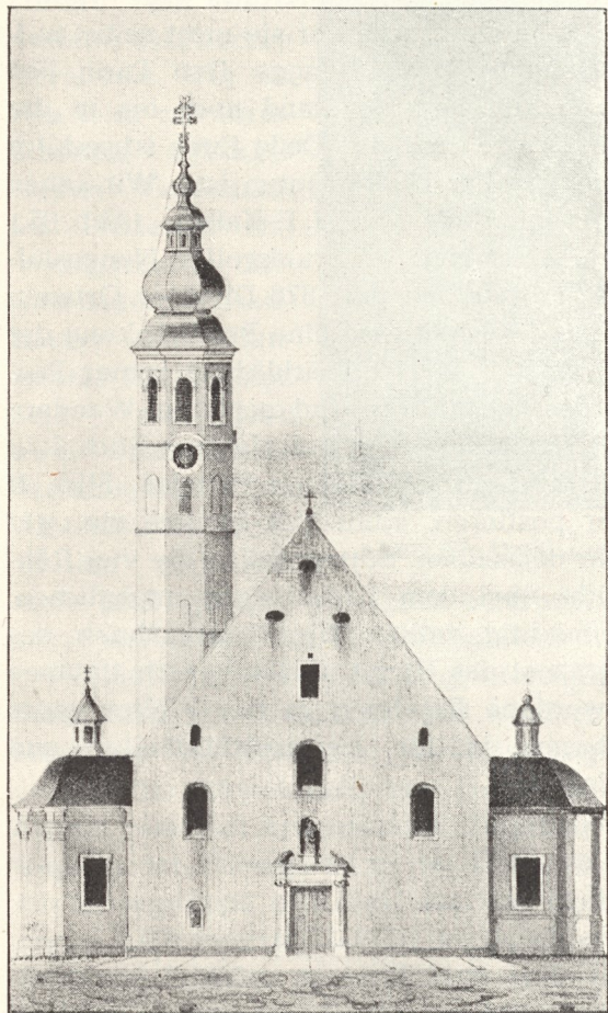
Abb. 95. Ursprüngliche Fassade.