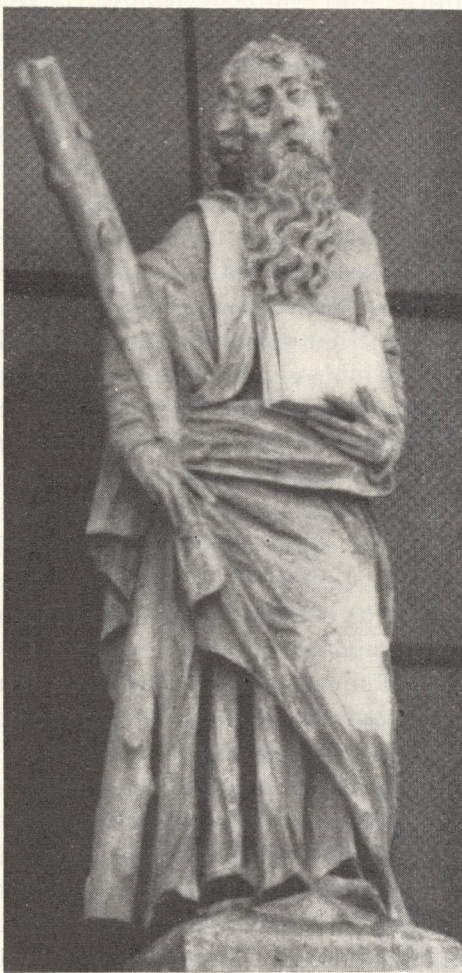
Abb. 91. St. Andreas

1. Wird von ihr mit Recht gesagt, sie sei ihrer Zeit sozusagen nachhinkend, in spätgotischer Tradition geformt, sei die nachgeborene Gestaltung eines gotischen Baugedankens. 2. Gehört ihre Geschichte zu der unserer Stadtpfarrkirche, ist sie deren Abschluß, der durch die gemeinsamen Bauherren Licht zurückwirft auch auf die Kirche zum Hl. Blut, ja auf die Fronleichnamskapelle. 3. Man lächle nicht, dieser Grund ist nur scheinbar persönlicher Natur: In der Aufhellung der Vergangenheit der Kirche zum heiligen Andreas, die noch in keiner ausgereiften Broschüre, geschweige denn einem Buch behandelt wurde, sind mir Erfolge beschieden gewesen, die ich möglichst bald zum Gemeingut der kunsthistorisch interessierten Öffentlichkeit machen möchte: Baumeister, Baukosten, Hochaltarbildmaler und manch