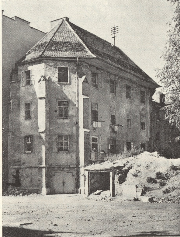
Abb. 78. Elegischer Ausklang ...

Der Ausschnitt aus dem Stiche Hollars, Abbildung 73, die wir der Titelseite des Kapitels zum Blickfang und Schmuck gaben, zeigt noch einen Dachreiter mit frühbarocker Haube. Der „Thurn“, den Pietro Valnegro bald nach 1635 aufführte, scheint ein wirklicher Turm gewesen zu sein, der sich an der Gassenfront vom Erdboden auf erhob. Er wurde nach der Aufhebung des Klosters abgetragen, das Monasterium in ein Wohnhaus umgebaut. Nur der Blick von der Stiftgasse nach Westen verrät noch zwiespältig, daß der fensterübersäte Bau ursprünglich eine stattliche gotische Kirche war.