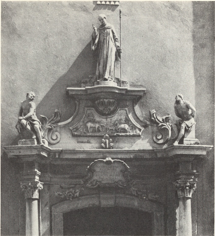
Abb. 70. Das Portal 1776

zweifellos derselbe Meister für Pöllau. Die Gegenüberstellung der Lichtbilder der Hl. Anna in Pöllauberg, St. Leonhard und Pöllau würde auf den ersten Blick auch den Laien davon überzeugen, daß überall dieselbe Hand am Werke war. Kenner der Art des älteren Schokotnigg ersehen auch aus unserer Abbildung, Tafel 76, die charakteristischen Gesichtszüge — versonnen lächelnd, falten- und runzellos bis ins Greisenalter, die ordensfrauenartige, kreisrunde Einhüllung des Hauptes durch Kopfumhang und breitgelagertes Halstuch — ganz ähnlich sehen die Karmeliterinnen auf dem Hochaltar