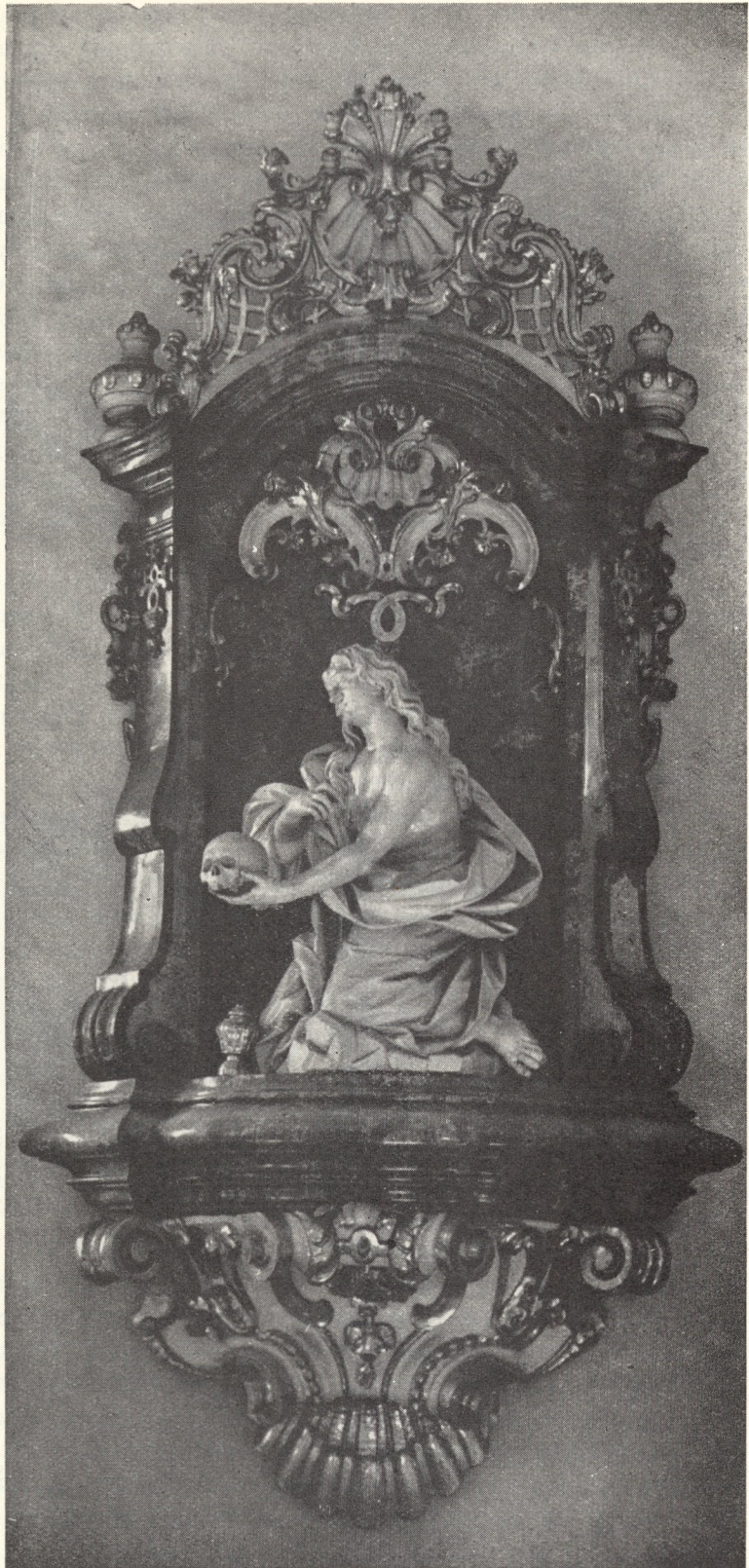
Abb. 67. Magdalenen-Thron.