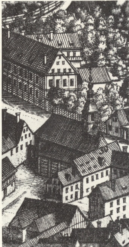
Abb. 65. Das Bürgerhospital 1703

Schon 1267 unterhielt der deutsche Ritterorden in unmittelbarer Nähe der Leechkirche ein Spital, das der den Brüdern zugehörige Hospitalarius oder Spittelmeister führte. Die Dominikanerinnen betreuten ein Krankenhaus zumindest schon 17 Jahre nach