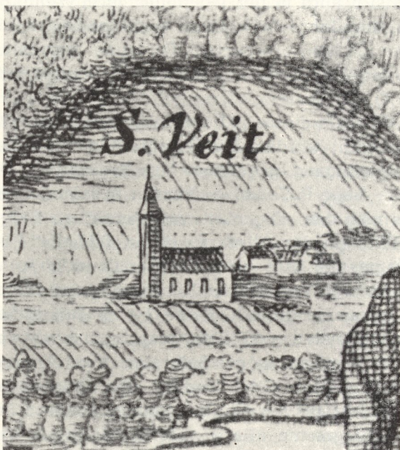
Abb. 63. Alt-St. Veit um 1635

auch gleich um 1239 einen Otto plebanus Sti Viti, „der Stadtpfarrer von Graz wurde“. Ein Otto von Liechtenstein war tatsächlich von 1239 an Pfarrer von St. Gilgen. Da nach diesem Gewährsmann Andritz um 1266, Neustift 1202, Statteggar schon um 1192 beglaubigt ist, darf man ruhig annehmen, daß sich in dieser Gegend, die pfarrlich nach St. Ägydus gehörte, schon im 13. Jahrhundert ein wenn auch unselb-