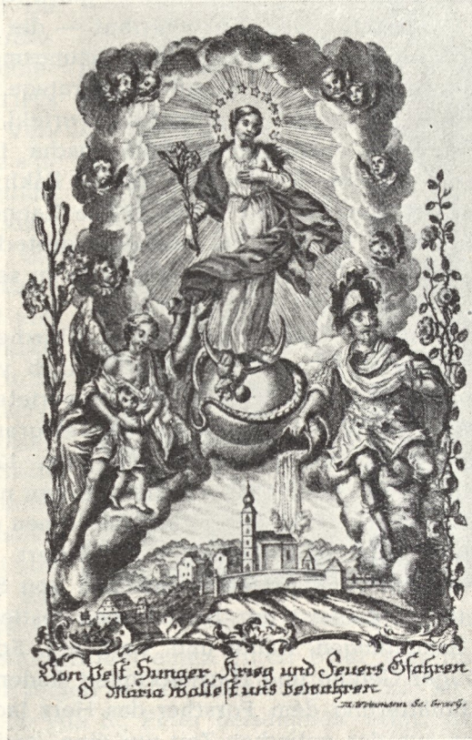
Abb. 51. Bruderschaftsbild