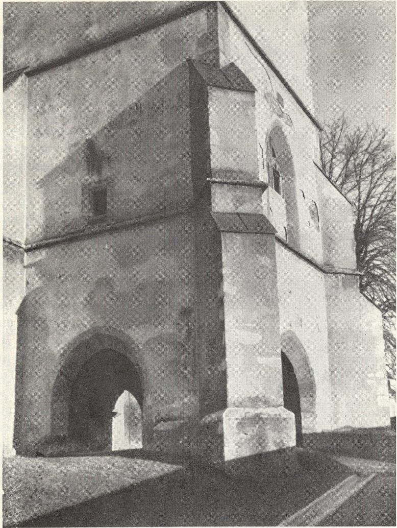
Abb. 52. Tordurchbrochenes Turmfundament

St. Peter unter Graz" 12 Groschen trägt. Bedeutsam aber ist die Abschrift einer Bulle des Papstes Urban VIII. vom Jahre 1642. Sie bezeugt, daß schon damals in St. Peter prope Graecium eine Bruderschaft bestand unter dem Titel der Unbefleckten Empfängnis. Sie bringt einleitend eine Bulle Paulus V. anno 1607 in Erinnerung. Da stand noch die alte Kirche. Da ist nun schon von einer Kapelle Conceptionis die Rede und von der Verehrung des hl. Schutzengels. Ein Umschlagblatt größeren Formats des 18. Jahrhunderts betont, daß die „Hochlöbliche Bruderschaft“ von diesem Papste nicht erst gegründet, sondern bekräftigt wurde, sie war auch zu Ehren des glorreichen Martyrers Florianus errichtet. Der Bogen zeigt einen Stich, auf dem die drei genannten Heiligen über dem Ortsbild schweben. Dieses stammt von einem Stecher, der es mit eigenem Auge kaum gesehen