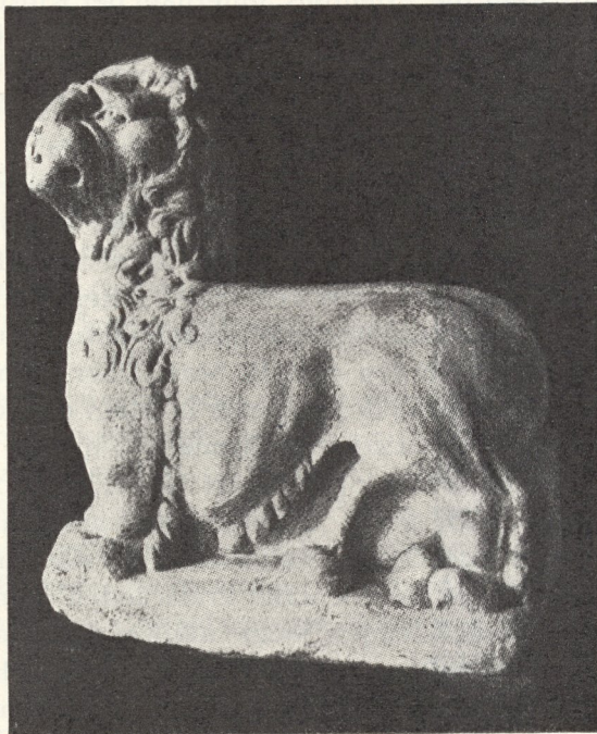
Abb. 49. Ein Portallöwe der Thomaskapelle

Noch Wonsiedler glaubte an ihnen „die Hand der Römer“ zu