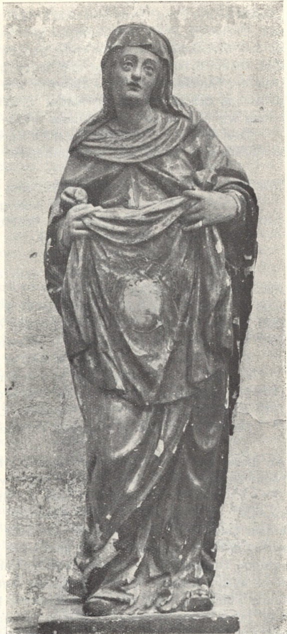
Abb. 54. Veronika mit dem Schweißstuch