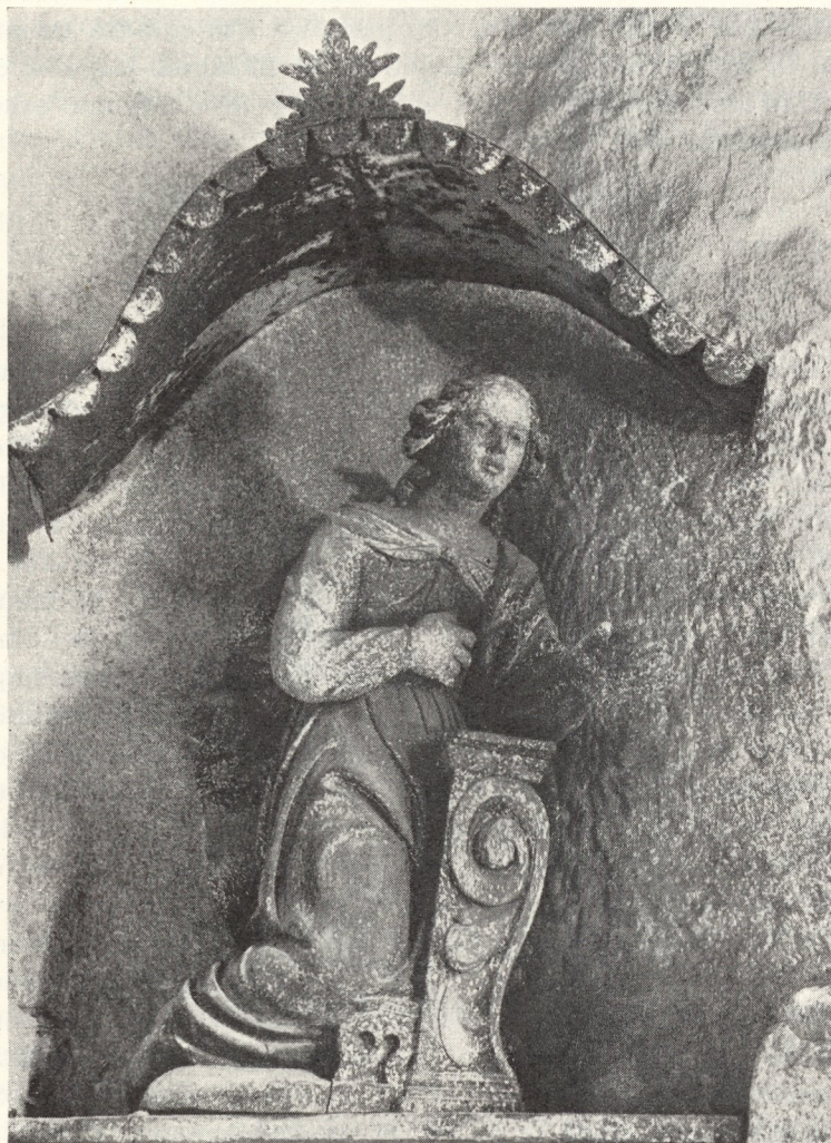
Abb. 50. Maria im Turm . . .