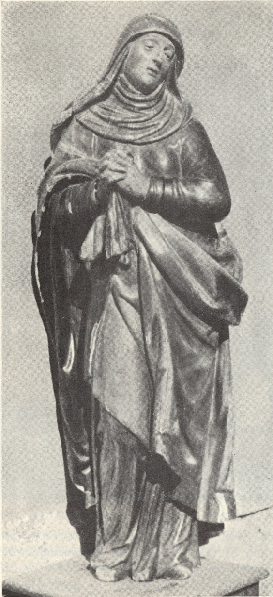
Abb. 53. Mater Dolorosa

Die Risse im Gewölb waren wohl bedenklicher, als der Visitator anmerken wollte. Ein gutes Jahrzehnt später schritt man zu einem Neubau. Der Initiator war wohl Pfarrer Kranzbauer, der 1604 bereits eine neue Peterskapelle am Friedhof errichtet hatte. Archivalische Hinweise auf den Umbau fehlen, der Baumeister läßt sich, da an dem braven Durchschnittsbau charakteristische Eigenheiten fehlen, auch nicht vermutungsweise nennen. Schriftlich überliefert ist nur, daß der Bauherr zur Finanzierung des Vorhabens 1642 bei der Florianibruderschaft ein Darlehen aufnahm „aus Notdurft beim Kirchengebäu“, und die Kirchenverwaltung etliche Grundstücke verkaufen mußte. Daß der Bau schon längerher vor sich ging, ersieht man daraus, daß die Steirische Landschaft 1638 eine Zuwendung an die Kirche machte. Ein Blick auf die Kirche (Tafel 50) beweist, daß nur Presbyterium und Schiff neu erbaut, der Turm aber aus der alten Anlage übernommen wurde. Die Tafel zeigt übrigens eine imposante Errungenschaft der letzten Jahre: Die beiden mächtigen Torpfeiler mit den markanten Relief-Emblemen des Titelhiligen. Die barocken Büsten der Apostelfürsten sind dem Stiegenaufgang, auf den wir noch zurückkommen, entnommen. Die Statue des hl. Engelbert an der Stirnwand der Kapelle ist der Überrest eines Dollfuß-Denkmales, die Gedenktafel wurde 1938 als staatsgefährdend entfernt.