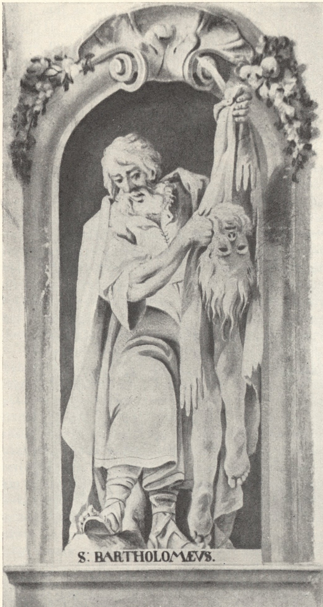
Abb. 16. Apostel Bartholomäus

schwingt verklärt und triumphierend das hölzerne Pastorale; nachdenklich, beinahe schon wehmütig verkündet der davor sitzende Putto (Tafel 13) aus dem ihn halb verdeckenden Buch die vielbesungene Tat der Mantelteilung und Armenbescherung, der kleine Mann gegenüber, schon etwas gefaßter mit der Palme in der Hand den Nachruhm des römischen Soldaten a. D. und frommen Bischofs in spe. Deutlicher freilich tut dies Amtskollege Eligius, der segnend über Pferd und Altar die Rechte hebt. Helm und Mitra liegen abgenommen an den Kanten des Standbildsockels, wenn es noch notwendig gewesen wäre, sichtbarlich und plastisch zu verkünden soldatische Pflichterfüllung und hohepriesterliche Segnung, Kampf des Diesseits und Lohn des Jenseits, gleichermaßen sichergestaltete Freude am Leben in Schöpfer und Schöpfung, an Gott und Mensch und aller Kreatur. Einen reizenden Barockengel haben wir in Abbildung 14 gleichsam als