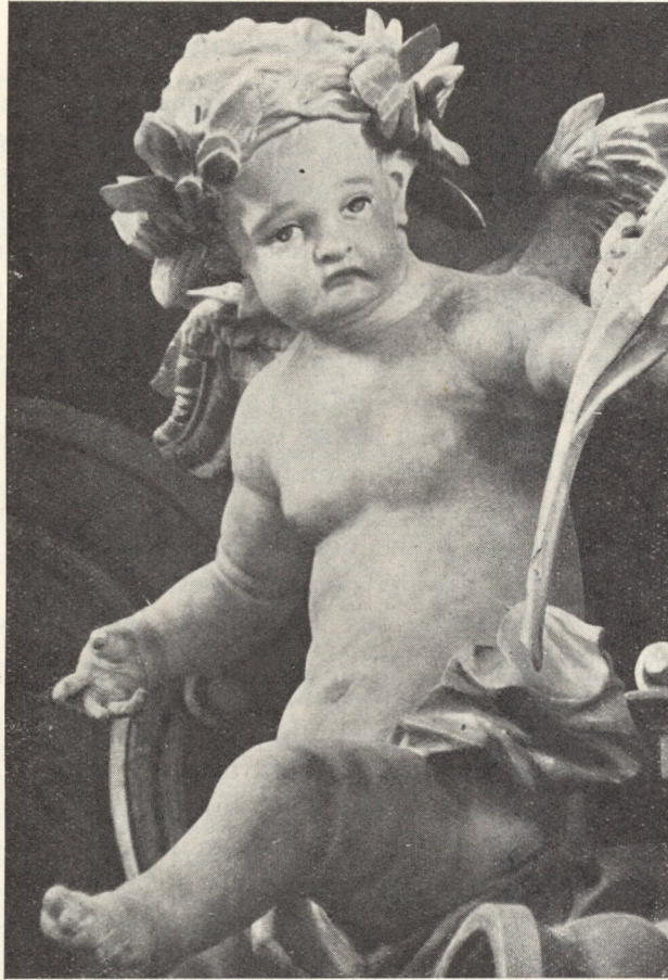
Abb. 14. Palme in der Hand, Lorbeer im Haar...