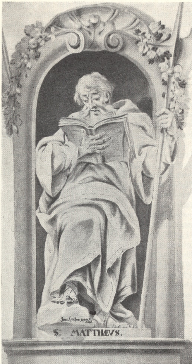
Abb. 17. Apostel Matthäus