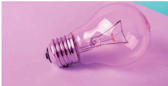
© Jacqueline Kircher – TU Graz