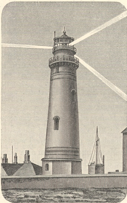
Fig. 1223. Leuchtturm von Helgoland mit elektrischem Drehfeuer (Blitzfeuer).

5 Sekunden einen Blitz von etwa \frac{1}{13} Sekunde Dauer zeigt) befindet sich auf der Landspitze Penmarch, südlich von Brest, 50 m über höchster Flut, Lichtstärke 10 Millionen Kerzen, sichtbar