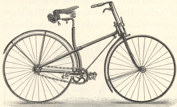
Fig. 880. Kreuzrahmen-Rover mit Vollreifen.

verkleinert, das Hinterrad gleichzeitig beträchtlich vergrößert. Dadurch war der Sitz nicht mehr so sehr nach vorn geschoben, außerdem auch niedriger, daher im ganzen weniger gefährlich. Die so entstandene Maschine, das sogenannte Cangaroo-Modell (Fig. 879), fand unter dem Namen des Sicherheits-Bicycle wieder mehr Anklang. Durch den Transmissionsmechanismus war hier schon das Verhältnis von Kurbelumdrehungen zu Radumdrehungen auf 1:1½ gebracht. Man trachtete nun, die Kettenübertragung noch zu vereinfachen und zugleich die Last des Fahrers in einer Weise