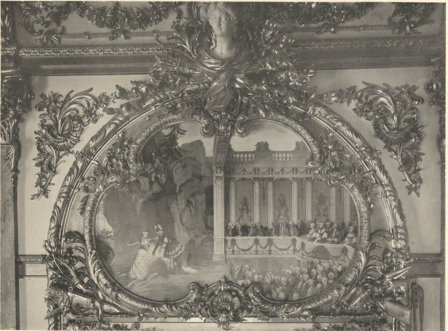
Ausgeführt im Atelier von Ph. PERRON, k. Professor und Bildhauer, München.