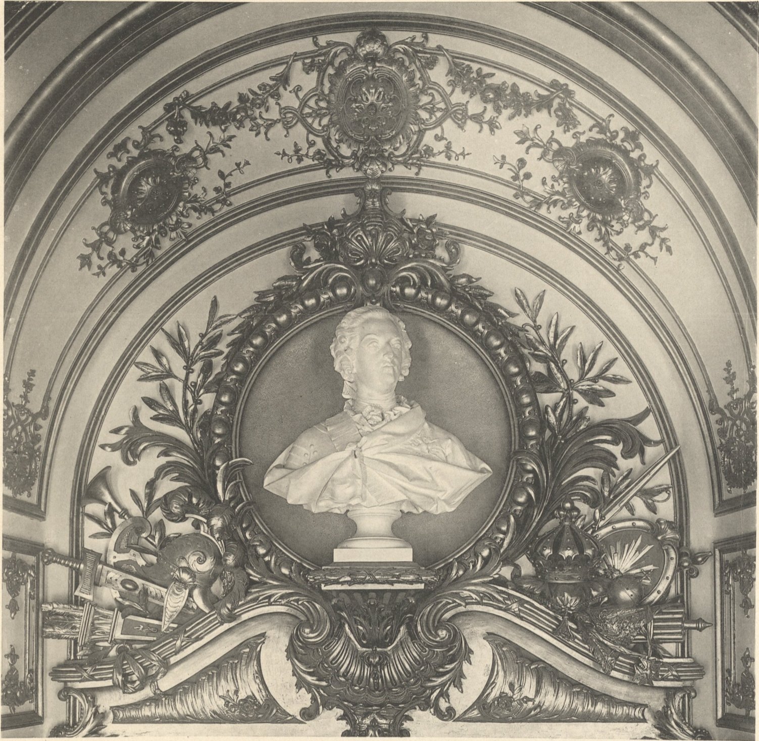
Thüraufsatz. Stuckarbeit. Louis XV.