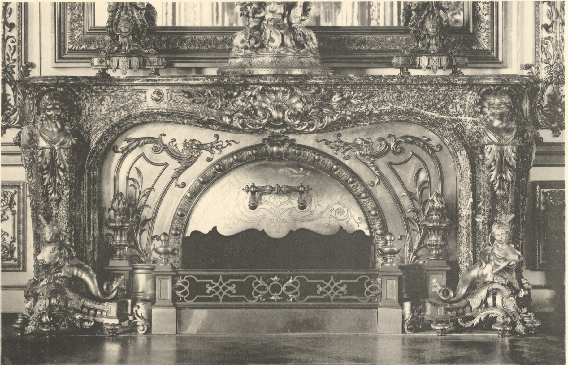
Ausgeführt im Atelier von PH. PERRON, k. Professor und Bildhauer, München.