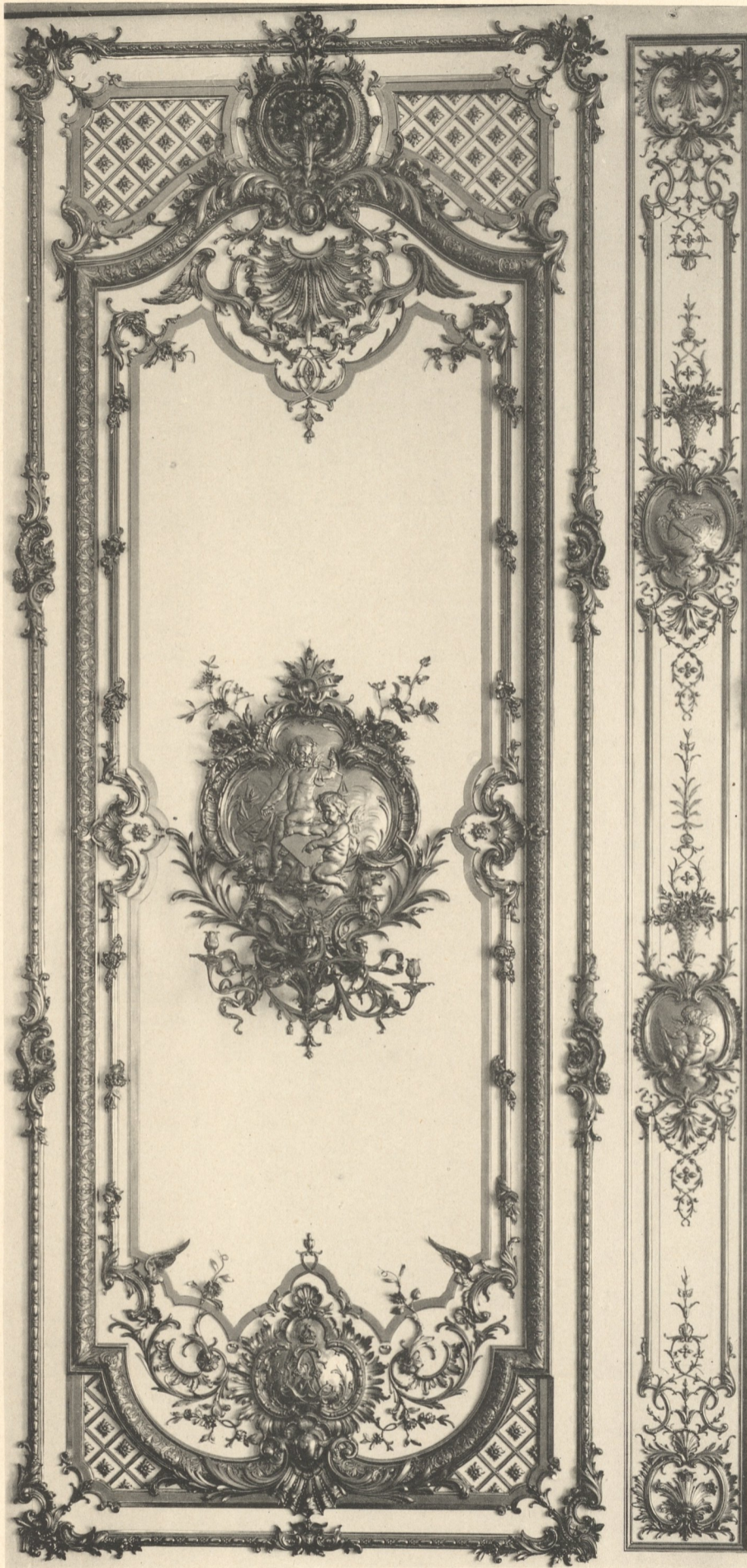
Ausgeführt im Atelier von PH. PERRON, k. Professor und Bildhauer, München.