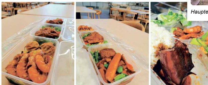
Gerichte in der Mensa: Das rot gekochte Schweinefleisch ist sehr beliebt. Es wird in Sojasauce zubereitet.