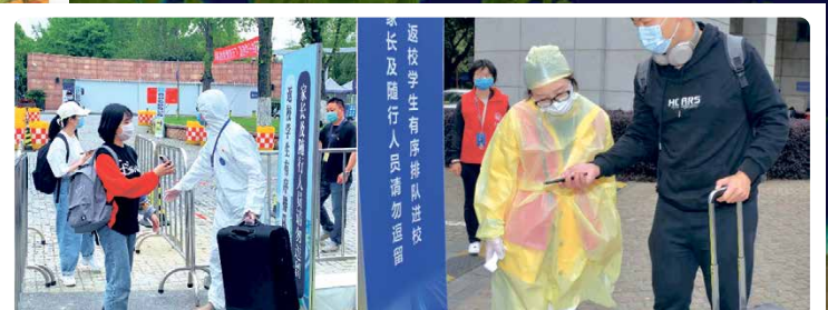
Wieder zurück an die Universität.