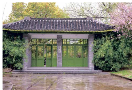
Haupteingang des Studierendenwohnheims.