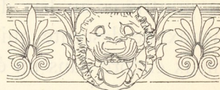
Fig. 351. — Chéneau antique de Métaponte.

Ce petit chéneau, c'est la doucine , dont un exemple bien connu est celle de Métaponte (fig. 351), laquelle fait par conséquent partie de la toiture et non de l'entablement. Et en effet, on voit des exemples de doucine en terre cuite, en métal, lorsque l'entablement est en pierre. Il est bien vrai que l'habitude a fini par considérer la doucine comme partie supérieure de la corniche, et que dans les errements modernes, la corniche, même à l'intérieur, se termine toujours par une doucine. Mais il est nécessaire de se rappeler son origine pour se rendre compte de certaines dispositions architecturales, notamment des frontons , dont je vous parlerai plus loin.