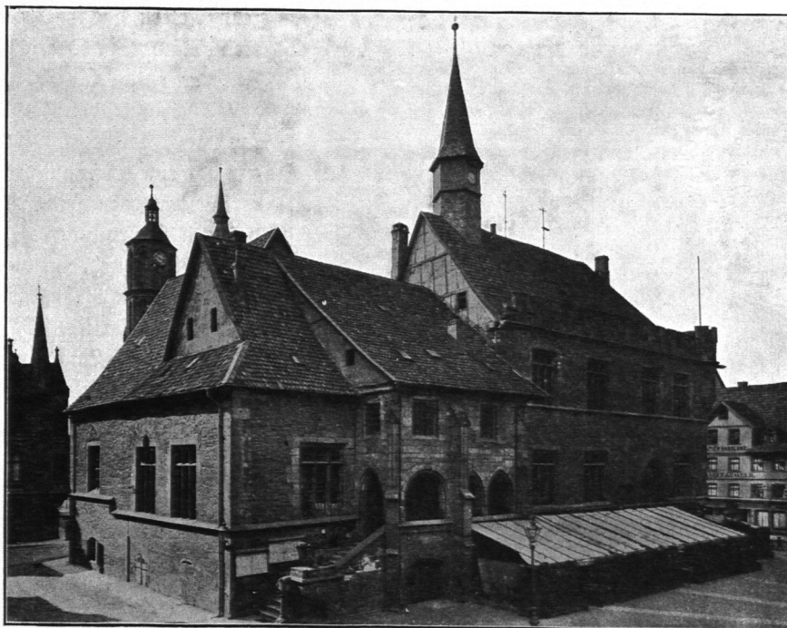
Abb. 124. Rathaus zu Göttingen.

des 14. Jahrhunderts in der zweiten Hälfte des 15. ein selbständiges Gebäude als Erweiterung entstanden, an dem jetzt der Name „altstädtisches Rathaus“ allein haftet. Da es von jeher nur als Ergänzung des schon bestehenden Kauf- und Rathauses dienen sollte, hat es eine von allen sonst bekannten Rathäusern abweichende Anlage erhalten. In der Gesamtform ähnelt es den Saalbauten mit seitlich angelegter Ratstube (Sulzbach usw.), aber die Innenteilung und die Entstehungsweise ist anders. Der älteste Teil ist das, was als kleinerer Anbau erscheint, ein Rechteck von etwa achtundeinhalb zu reichlich