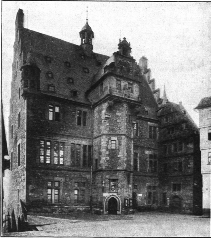
Abb. 102. Rathaus zu Marburg.

täfelten und lebhaft bemalten Ratsaal mit Nebenraum erreicht*). Auf der anderen Seite der Diele liegt eine weitere Schreibstube, sowie die für Veranstaltung von Festlichkeiten und Bewirtung hoher Herren unentbehrliche Küche.