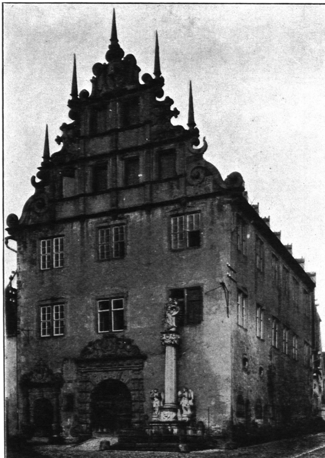
Abb. 100. Rathaus zu Sulzfeld.

„Als Bischoff Julius regirt — wurd difes Rathaus von neue volfürdt, — Das brauch du frommer Underthan — Wie es bedechtlich gesehen an — Schaff ab den nachteil bedenk den nutz — Nicht gutes an gibß gott zu schus — Und thue nuer nach deins hern wunsch — glaub gwis kein mühe würt sein umbsonst — Anno 1609.“