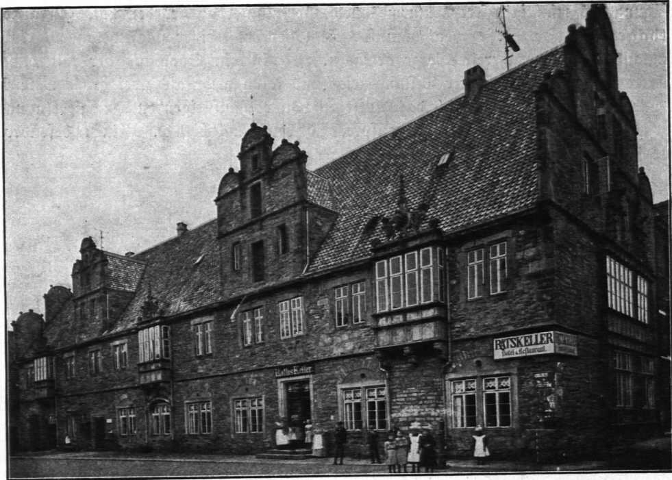
Abb. 51. Rathaus zu Stadthagen.

halten hat. Dort begannen die Bürger im Jahre 1381 ein Rathaus sehr bescheidener Abmessungen quer über die Mitte ihres schmalen, lang hingestreckten Marktplatzes zu bauen. Kaum war es fertig, so mußte es durch einen längsgerichteten Flügel erweitert werden, und im allmählichen Zufügen immer