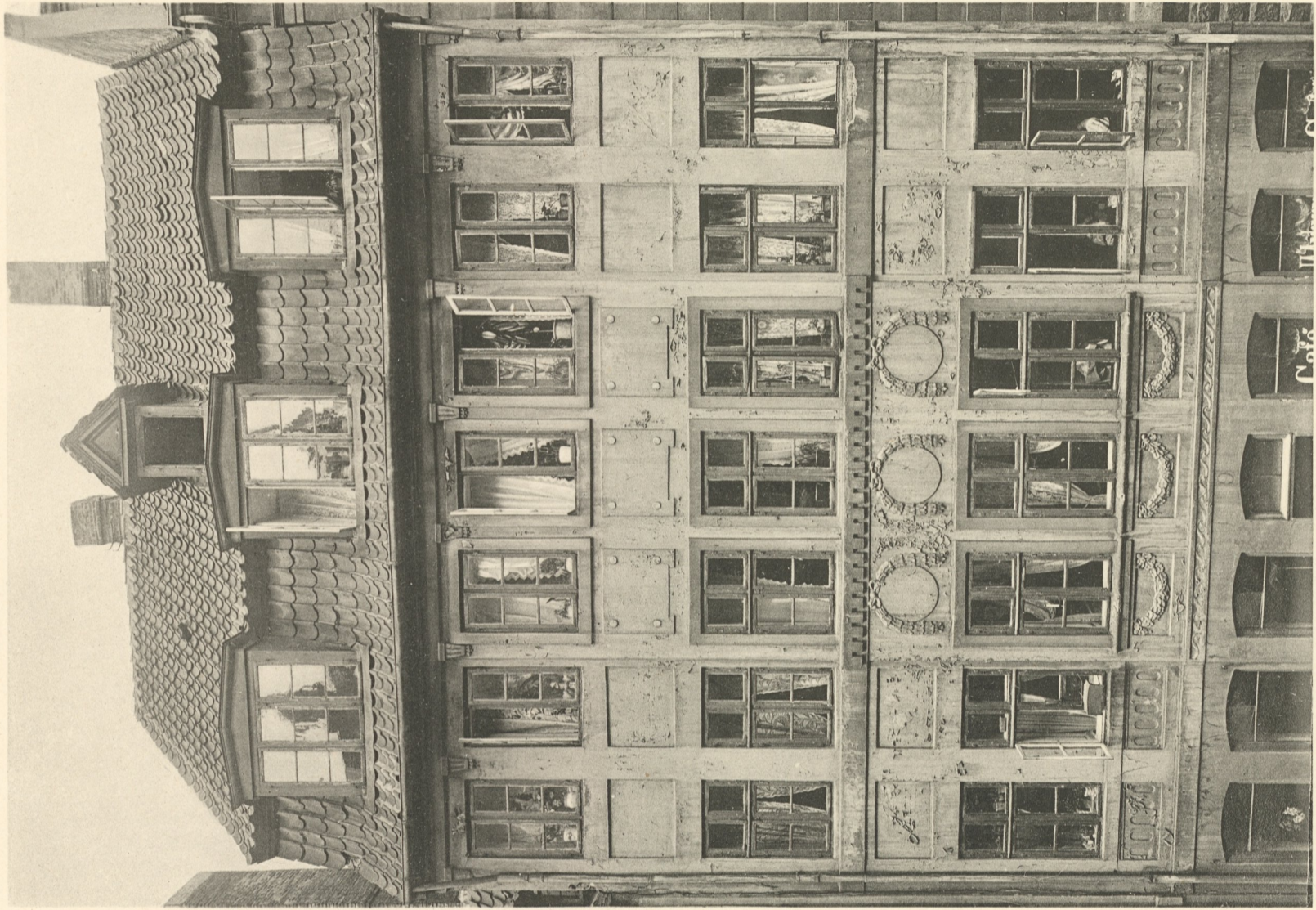
Haus Antonigade 9.