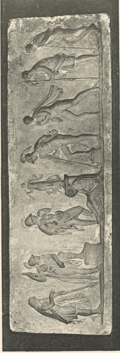
Friesmodell (Hohlform) eines Tischbein-Ofens im Göttinger Museum.