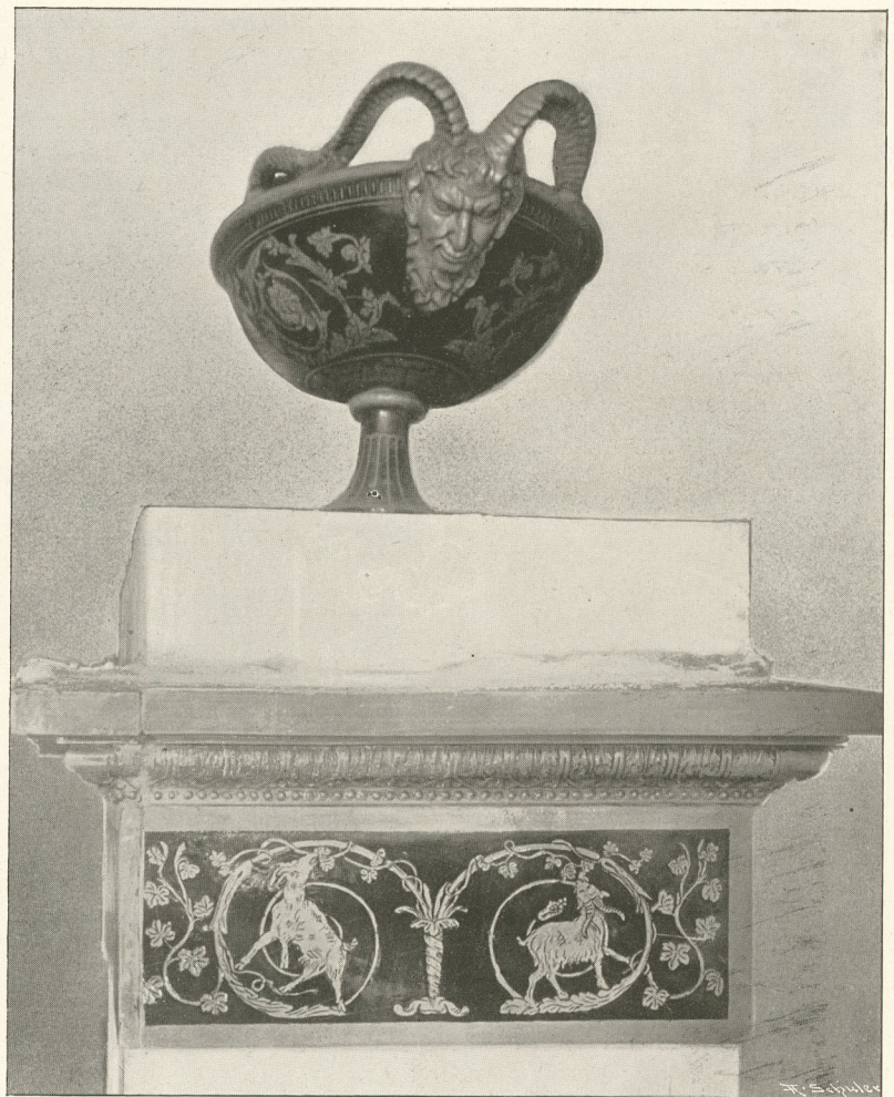
Oberteil eines Tischbein-Ofens im Neuen Palais zu Catin. (Vergl. Tafel 20.)