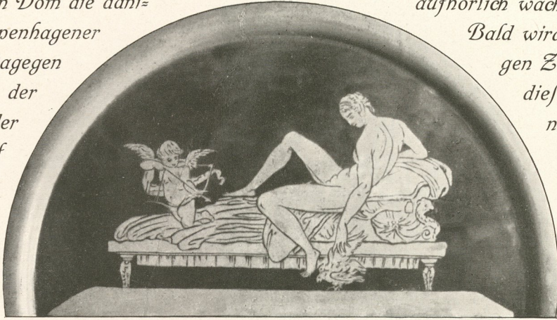
Ofenfüllung im Catiner Museum.

Das auf Seite 10 abgebildete Tor aus dem Kopenhagen benachbarten Roskilde, in dessen Dom die dänischen Könige ruhen, ist den Kopenhagener Arbeiten nahe verwandt. Dagegen zeigen die Türen und Tore in der alten Bischofsstadt Ripen an der Westküste Schlesiens, die auf Tafel 38 und 39 dargestellt sind, einen weit abweichenden Charakter, dessen Eigenart sich daraus erklärt, daß Ripen seine Blütezeit schon längst hinter sich hatte.