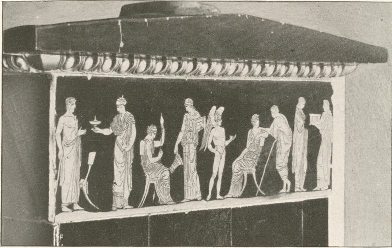
Oberteil eines Tischbein-Ofens in der Apotheke zu Catin.

war, erkennt man auch in Kopenhagen vor allem an den Haustüren und den besonders zahlreich erhaltenen großen Einfahrtstoren mit dem reichen Schmuck ihrer Oberlichte. Von diesen konnten hier mit Rücksicht auf den beschränkten Raum leider nur einzelne Stücke aufgenommen werden.