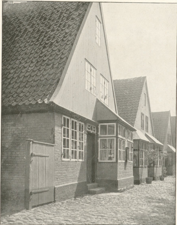
Strassenbild in Arnis.

Unsre Abbildungen geben mehrere Stücke in verschiedener Ausführung wieder. (Nähere Angaben S. 12.)