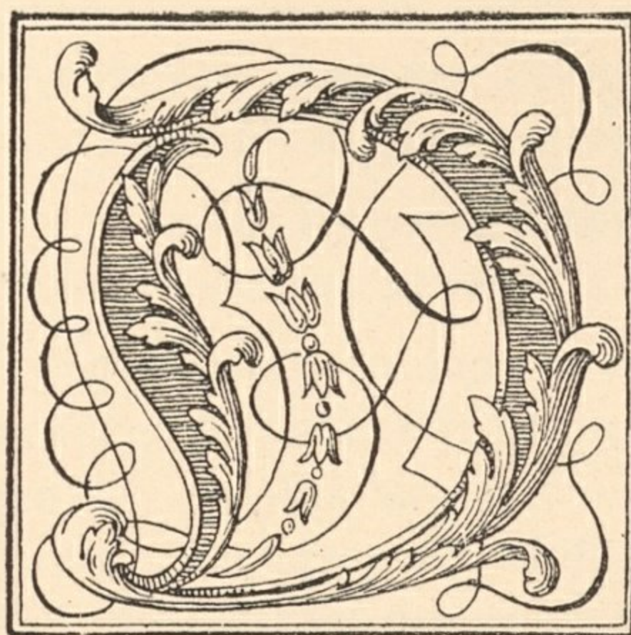
XVIII e siècle.

DANS la dernière partie du XVII e siècle, le genre italien est complètement oublié, et le goût se porte vers les Maîtres français. Les brillantes compositions de J. Le Pautre, de J. Berain, des Marot, etc., inspirent, sous le règne de Louis XIV, les artistes allemands, qui adoptent ce qu'on appelait alors en Allemagne le goût français . Abraham Drentwet, Paul Decker et Schubler sont les plus grands initiateurs du nouveau genre. En même temps, avec eux, tous les ornemanistes allemands marchent sur les traces des Maîtres français. Dans la première moitié du XVIII e siècle, le genre rocaille fait son apparition. Aussitôt l'école allemande s'empare avec enthousiasme de cette nouvelle ornementation; celle-ci, poussée jusqu'à sa dernière limite, tombe dans l'exagération et dans le mauvais goût. Vers la fin du XVIII e , l'effervescence s'apaise, les formes calmes et régulières du style Louis XVI règnent à leur tour jusqu'au commencement du XIX e siècle.