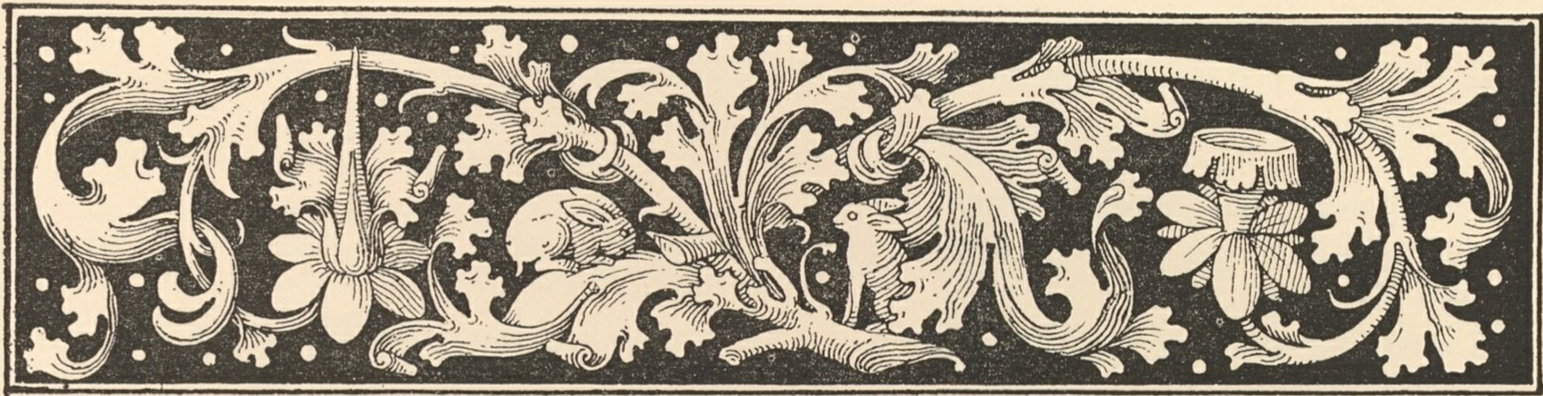
Tête de page de style gothique.