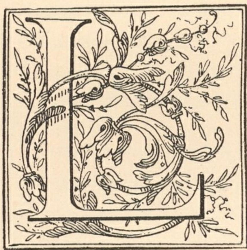
Lettrine Louis XVI.

Le style Louis XVI précède l'avènement du roi qui lui a donné son nom : on le voit poindre entre 1745 et 1750. Depuis cette époque jusqu'en 1770, il marche parallèlement avec le style Louis XV; cependant beaucoup de maîtres n'abandonnent point ce dernier, tout en produisant des compositions dans le nouveau goût. Nous aurons soin, afin d'éviter la confusion qui pourrait naître de la coexistence des deux styles, d'indiquer le genre auquel se rattachent les différentes pièces qu'il sont composées.