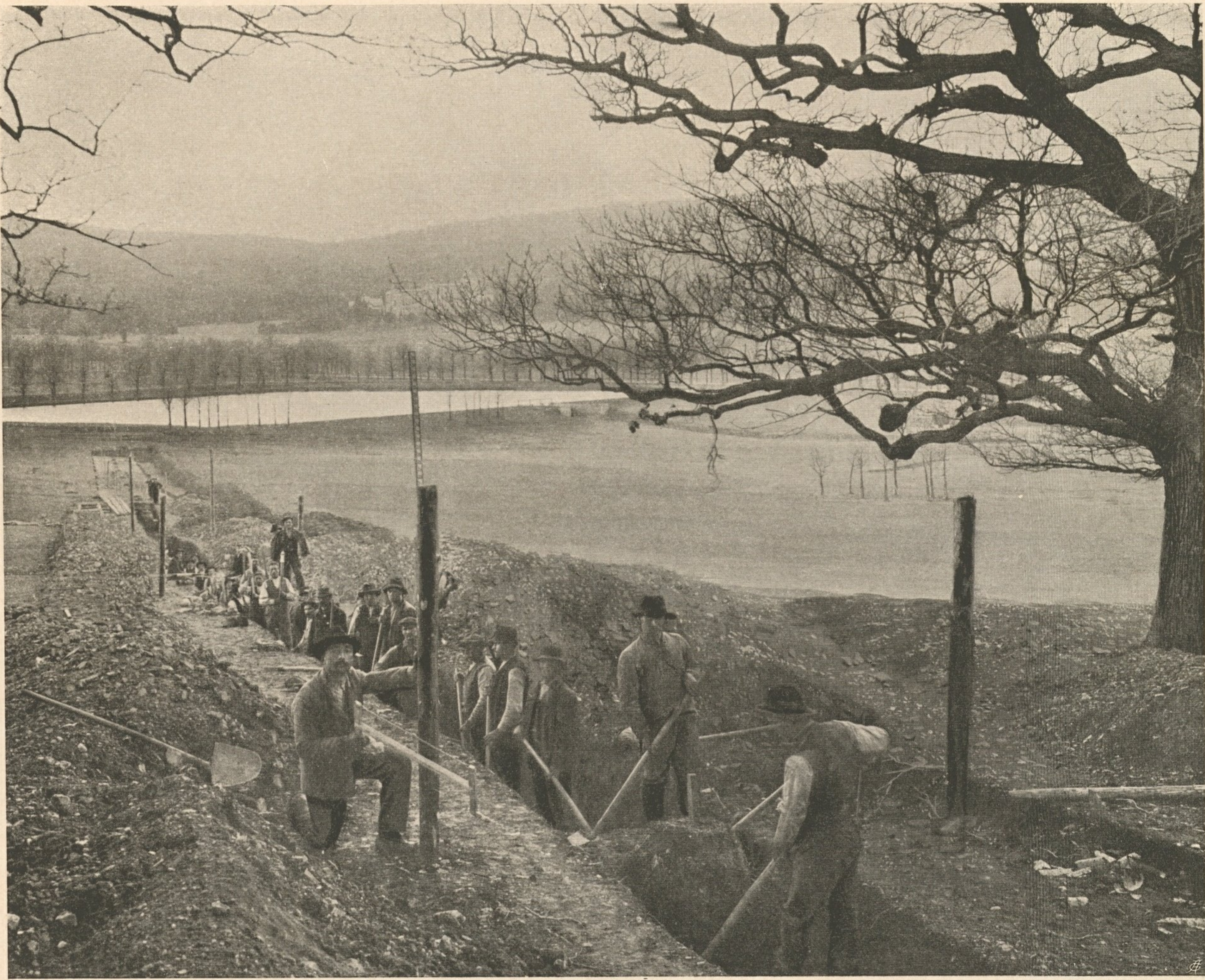
Nr. 147. Bau des Entleerungs- kanales im k. k. Tiergarten.