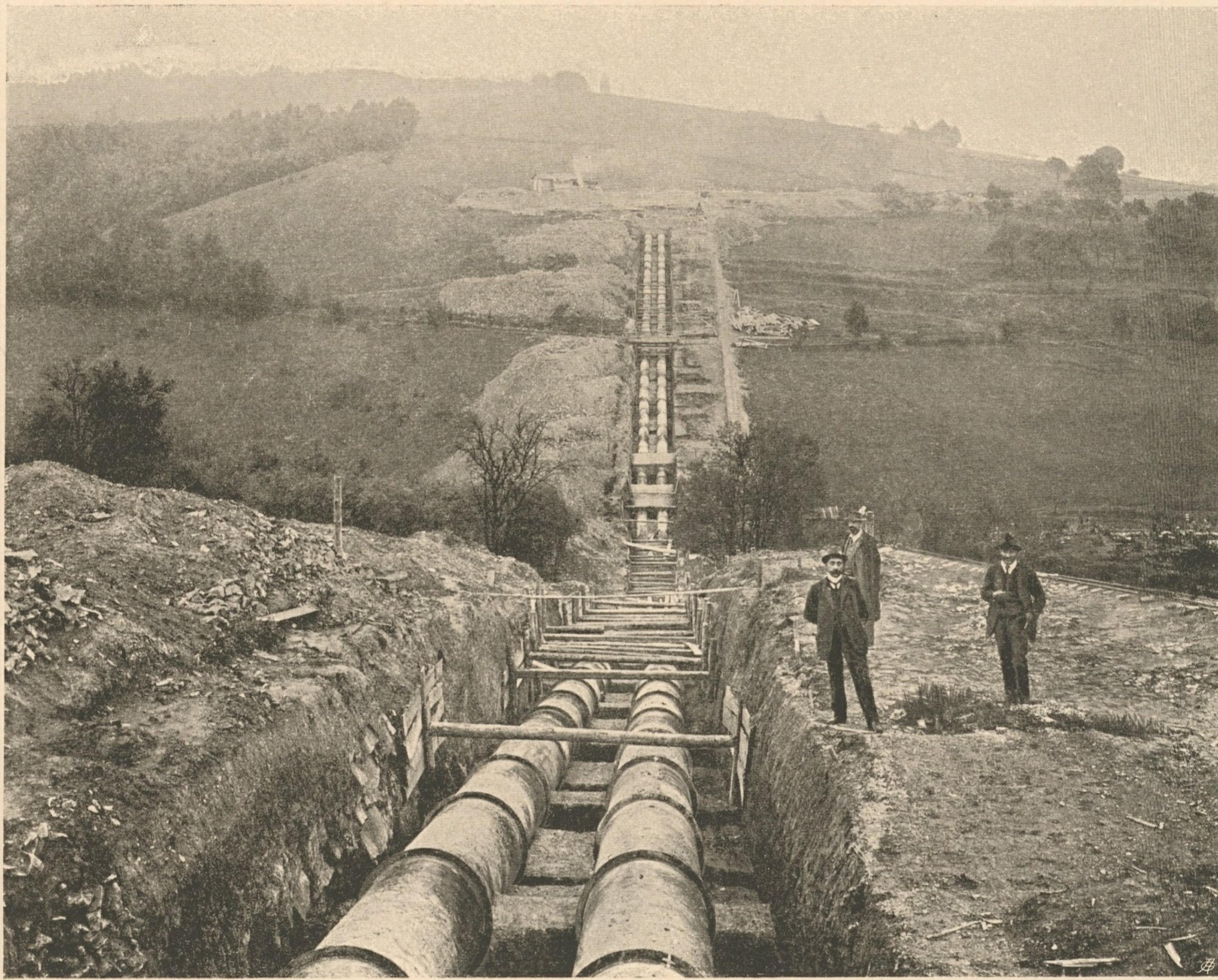
Nr. 126. Bau des Laaben- bachsiphons.