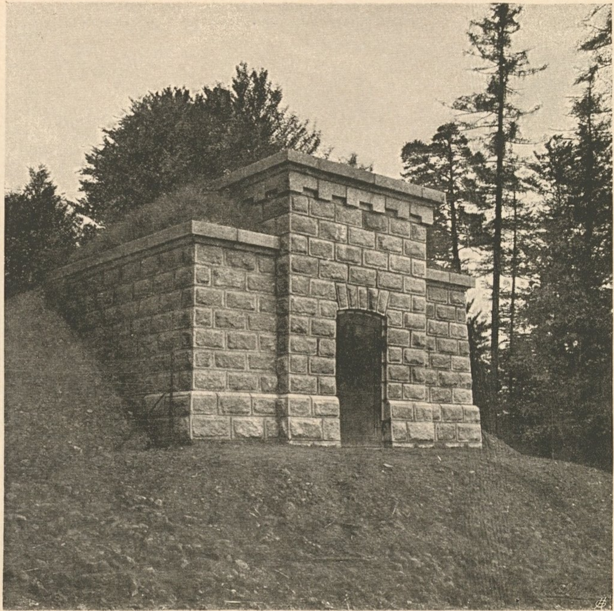
Nr. 117. Einlaufkammer des Siphons über das Perschlingtal.