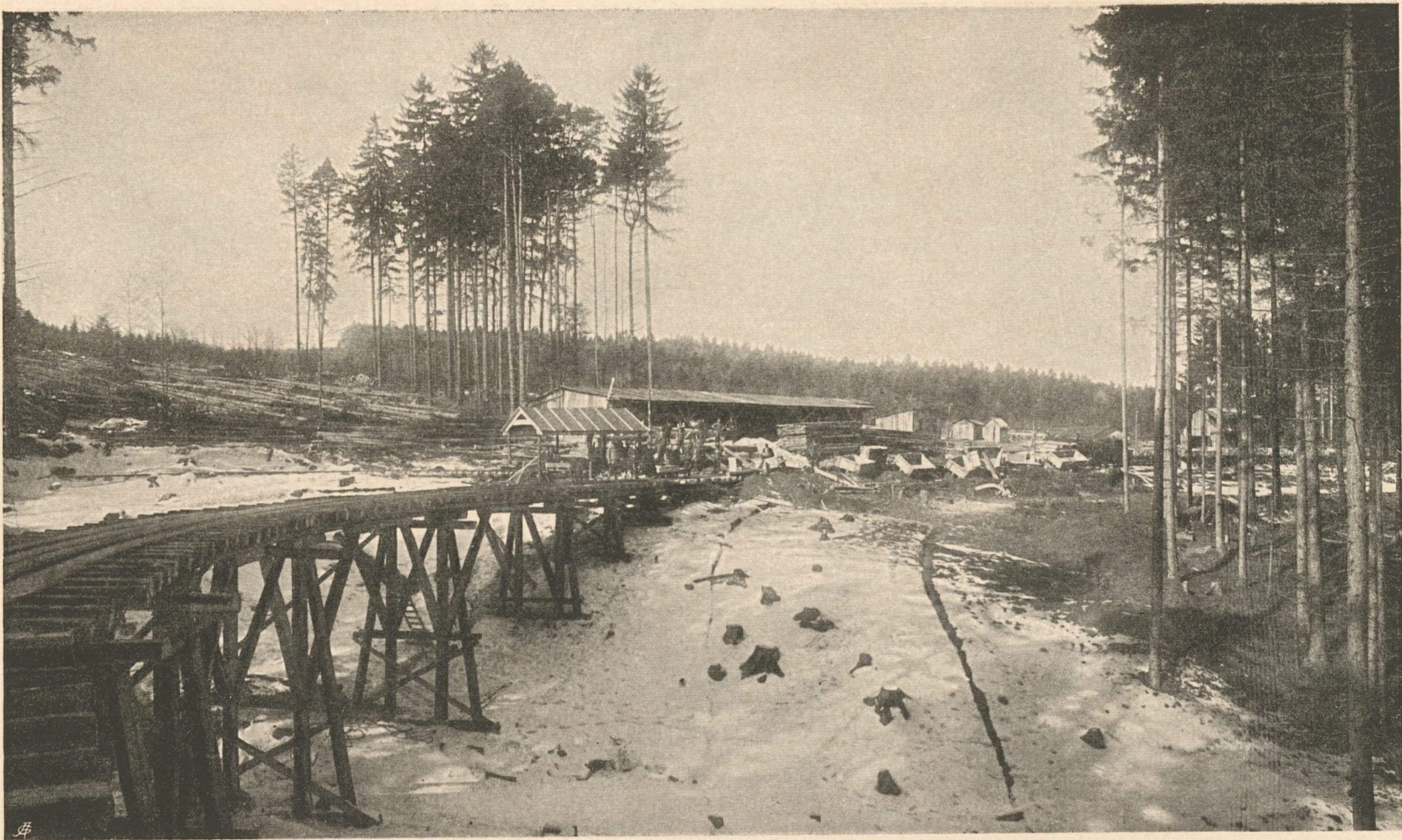
Nr. 112. Installations- anlage bei Ochsenburg.