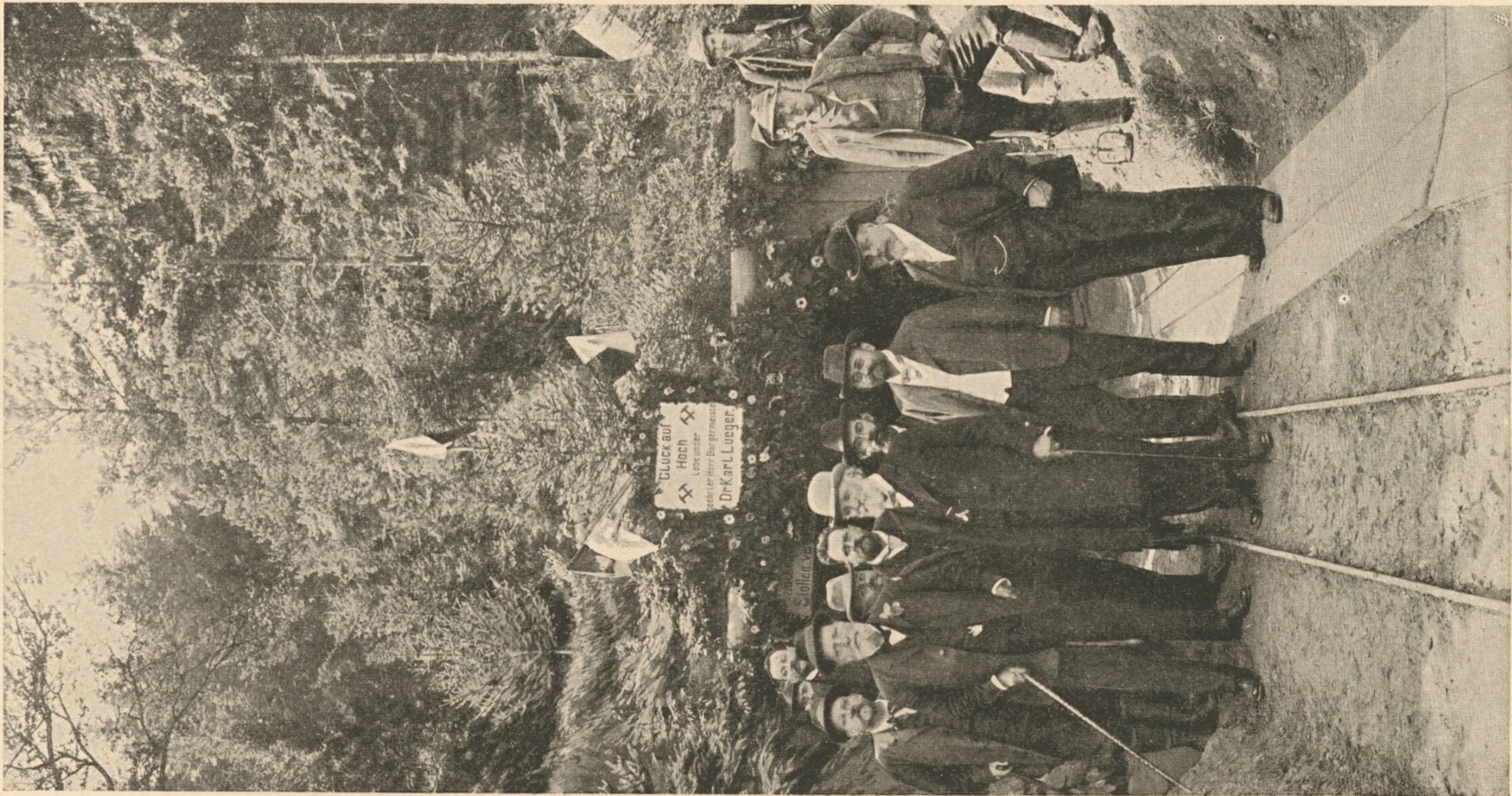
Nr. 103. Besichtigung des Rametzbergstollens.