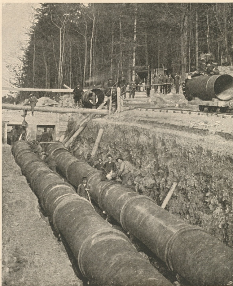
Nr. 80. Bau des Melksiphons.