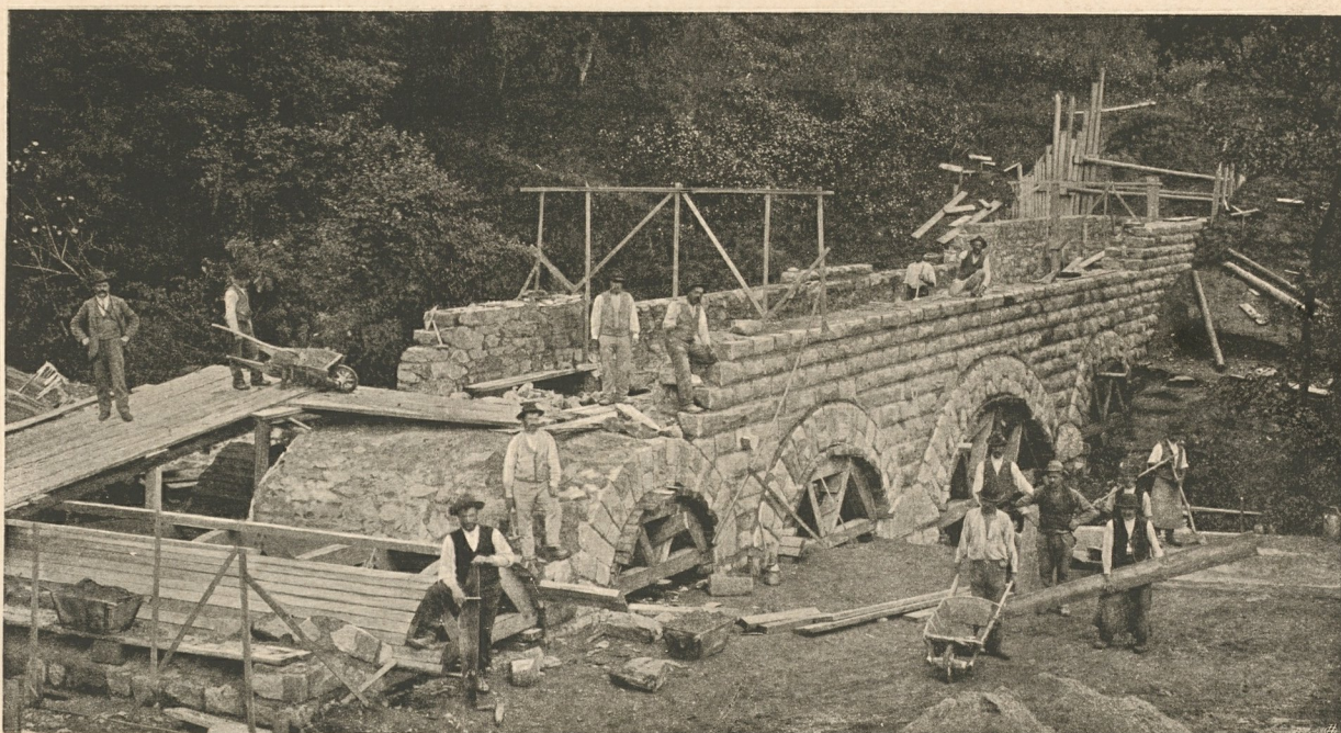
Nr. 77. Der Aquädukt über den Leysbach bei St. Georgen.