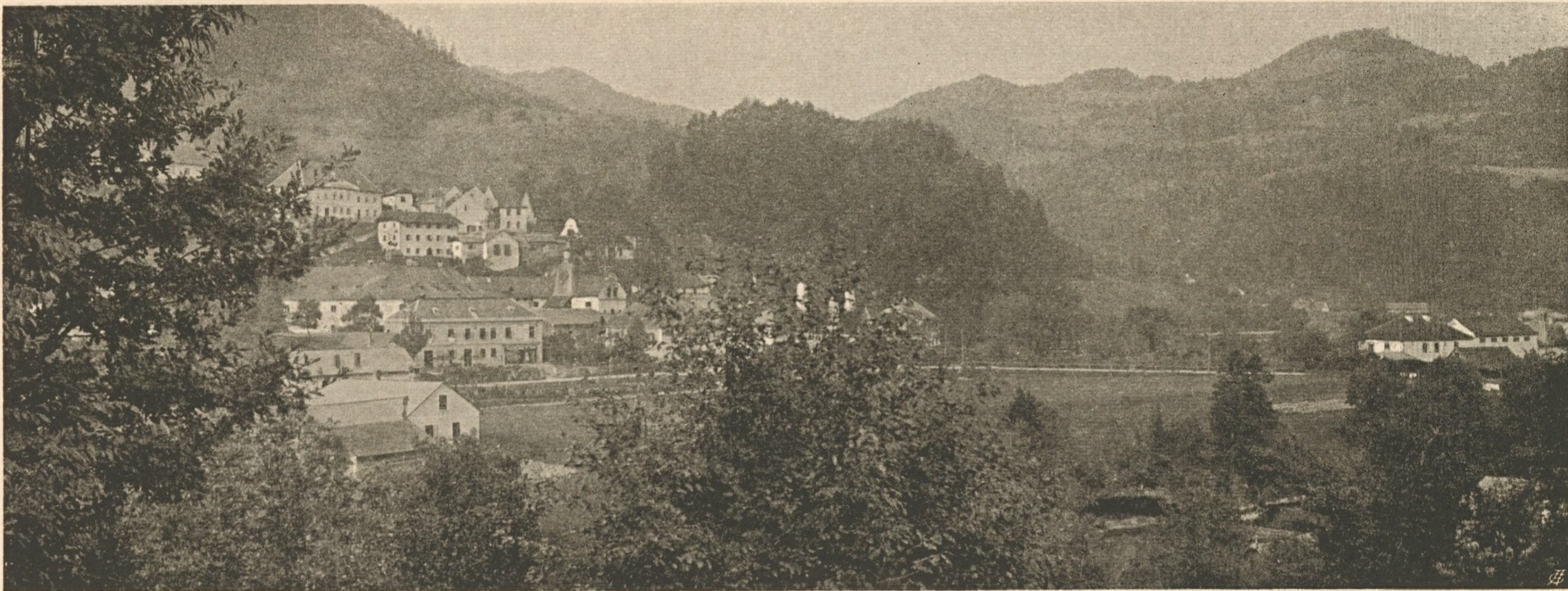
Nr. 66. Neustift bei Scheibbs.