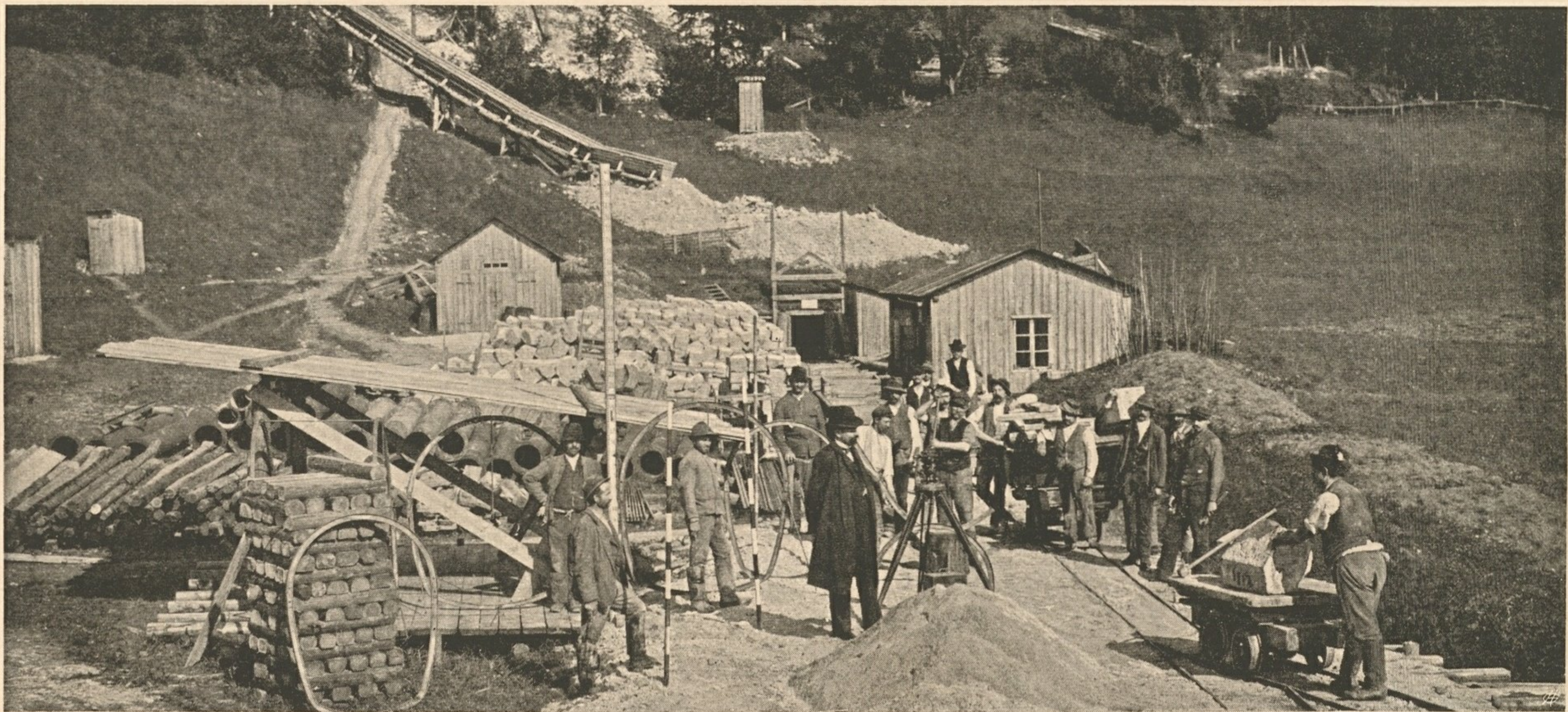
Nr. 54. Baustelle an der Nordseite des Grubbergstollens.