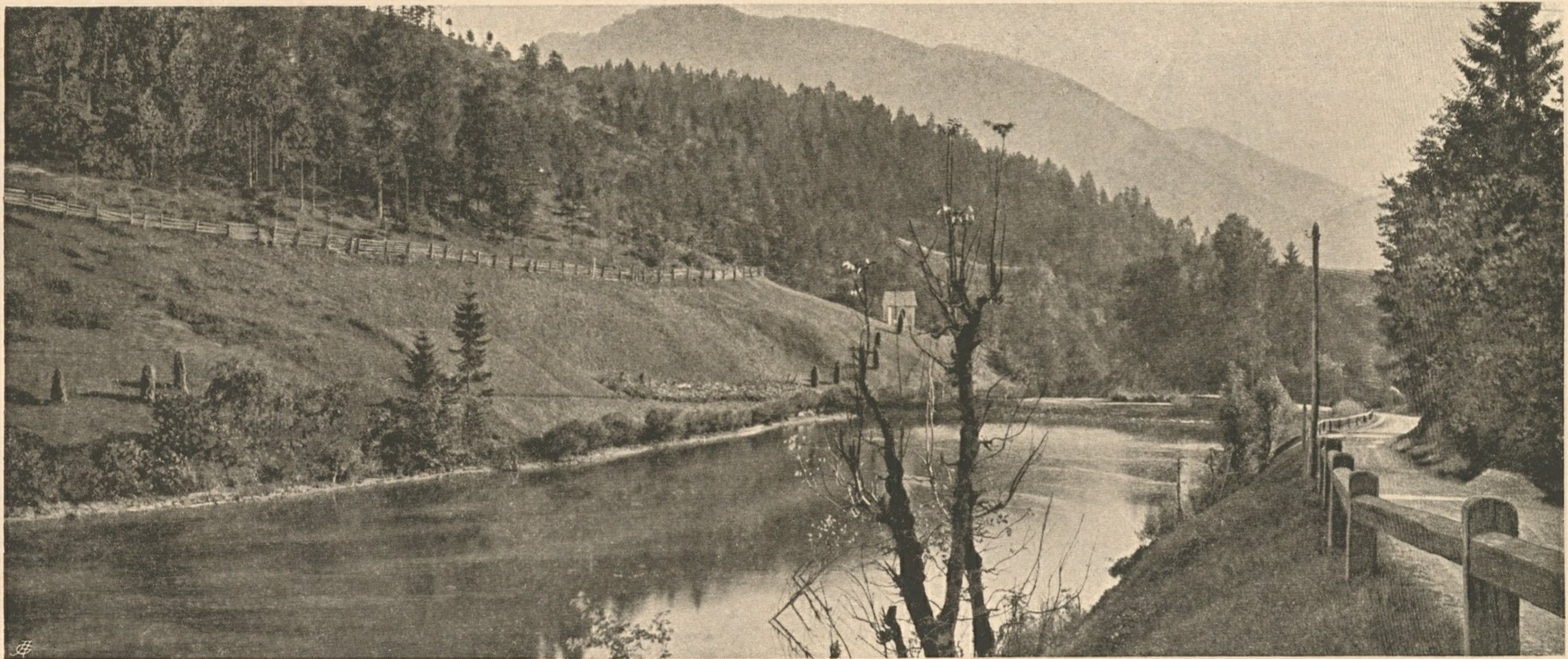
Nr. 52. Der Mausrodtteich an der Straße über den Grubberg bei Lunz.