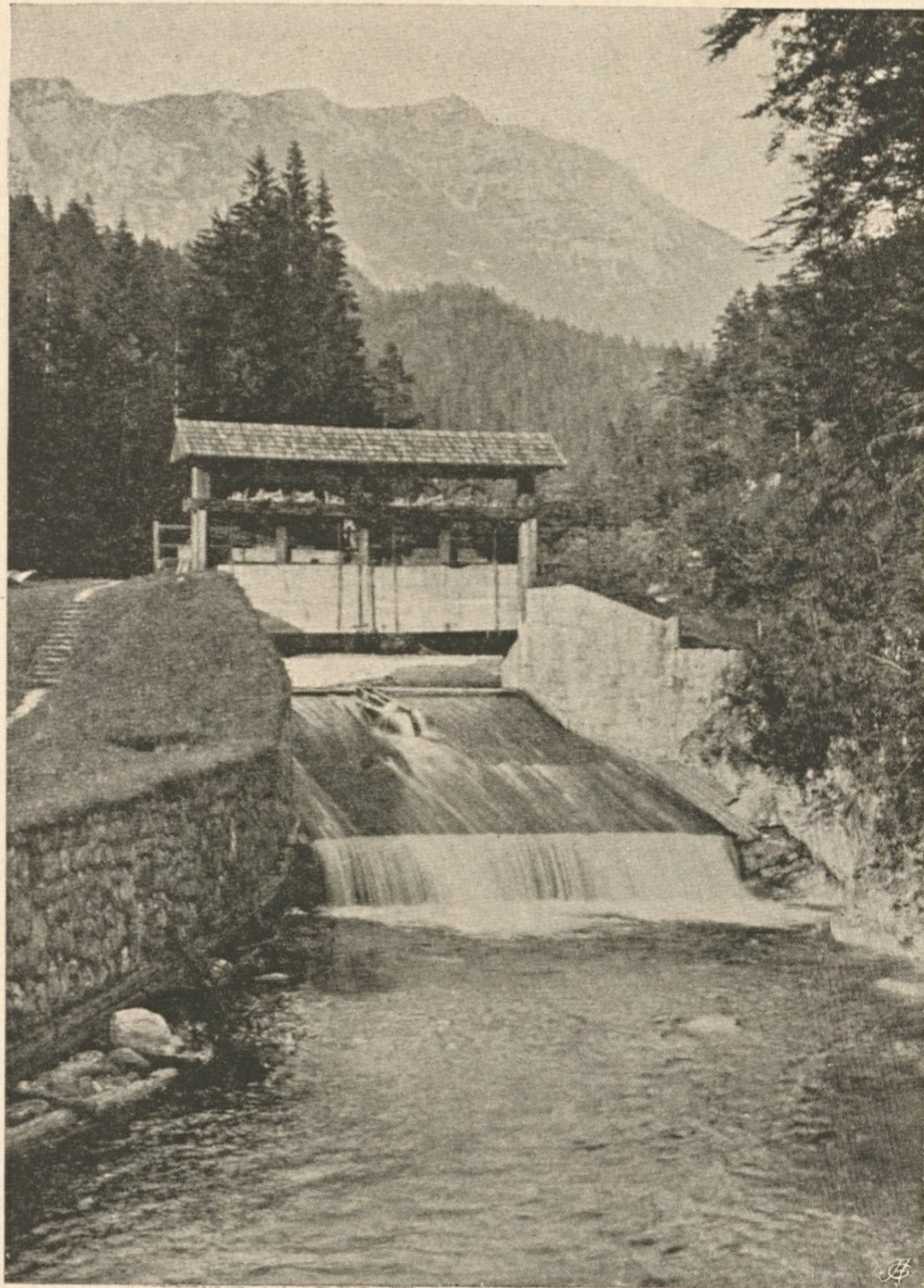
Nr. 36. Wehr am Hundsaubach mit dem Dürrenstein.