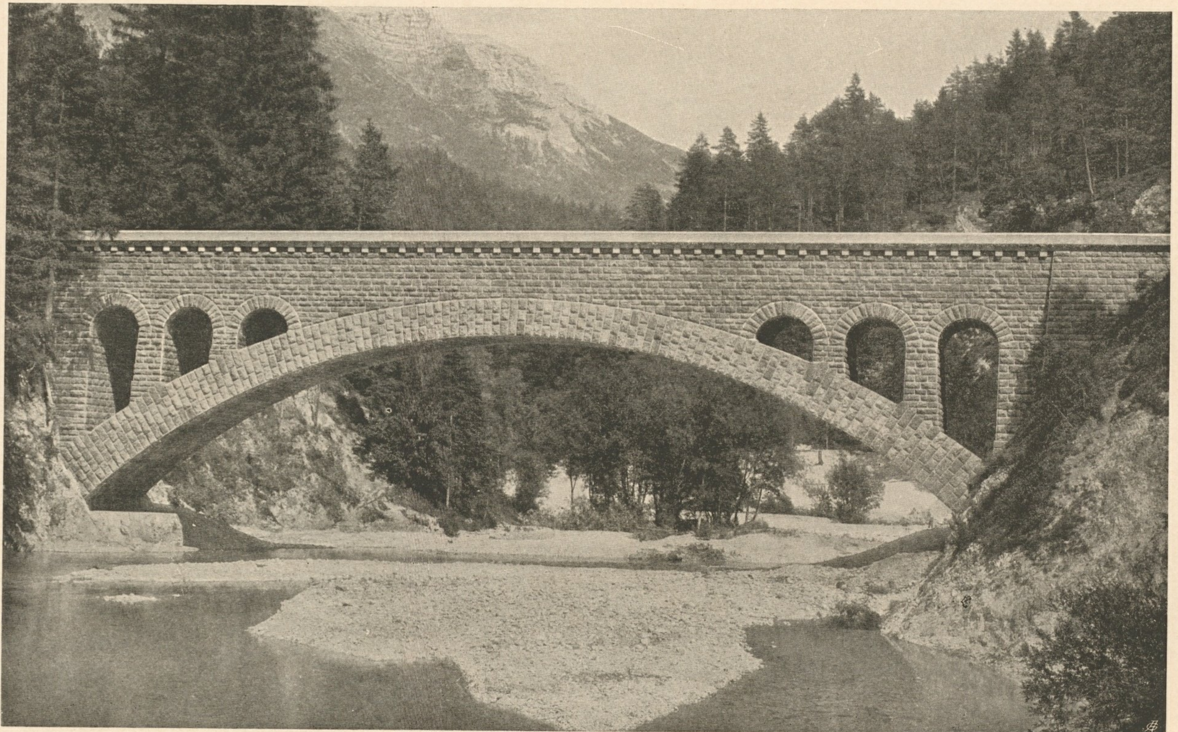
Nr. 38. Aquädukt über den Hundsaubach bei Göstling vollendet.