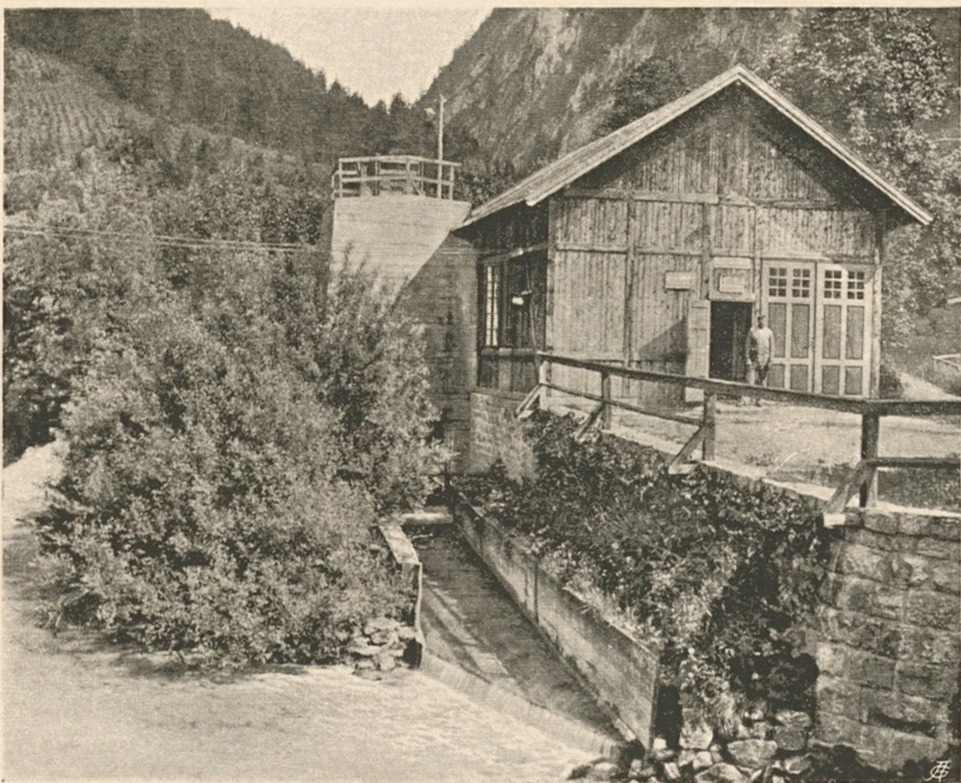
Nr. 30. Die elektrische Kraftzentrale am Steinbache für den maschi- nellen Stollenbau.