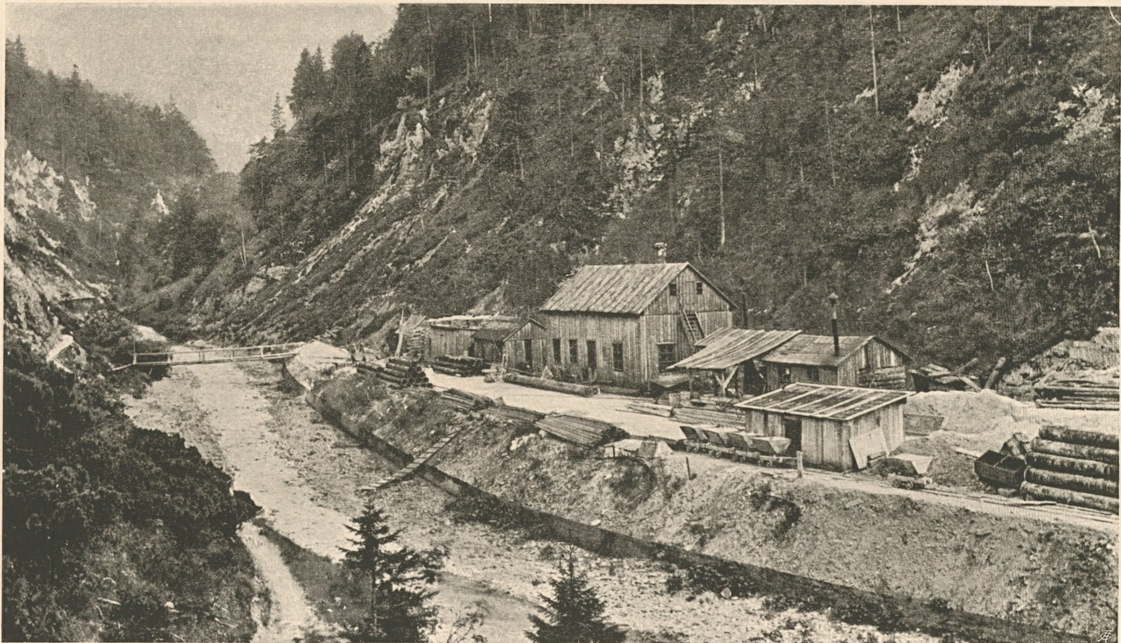
Nr. 29. Baustelle an der Nordseite des Stollens durch die Göstlinger Alpe.