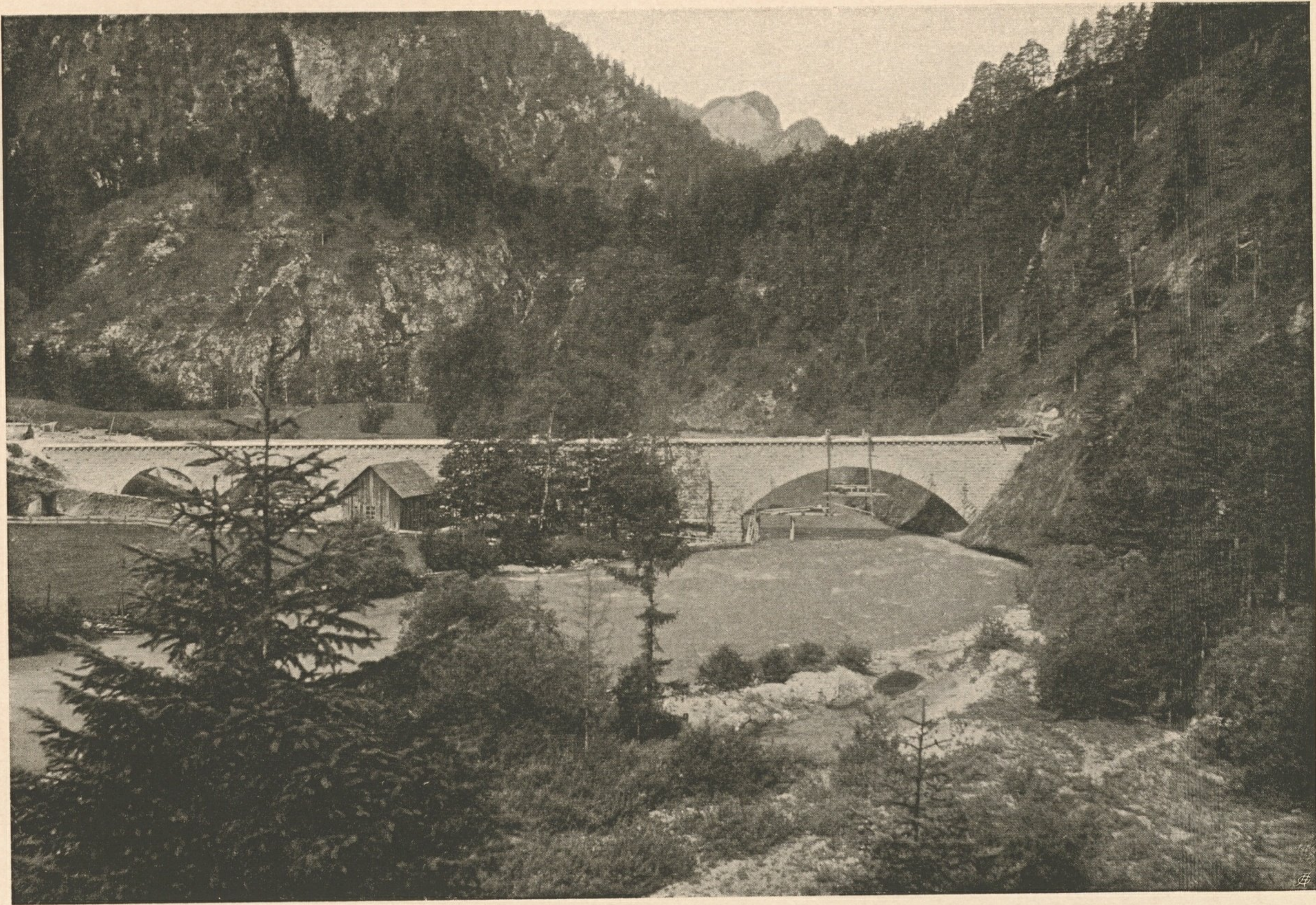
Nr. 24. Rohrbrücke über die Salza bei Wildalpe.