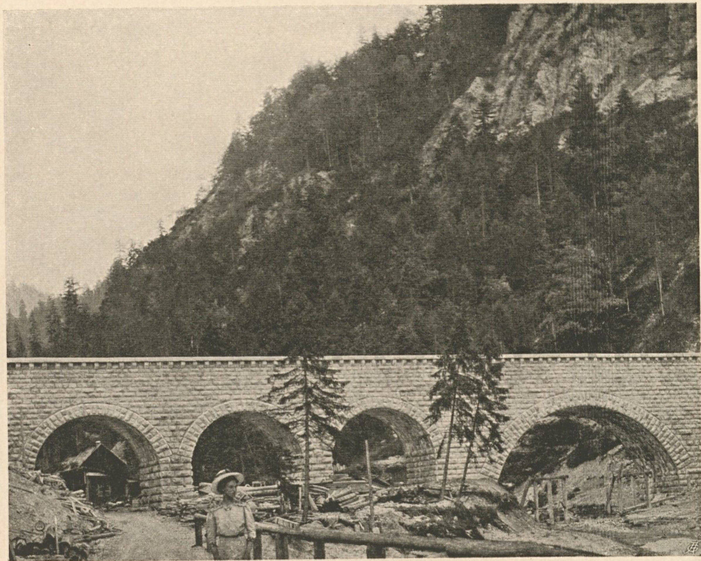
Nr. 26. Aquädukt über das Imbachtal.