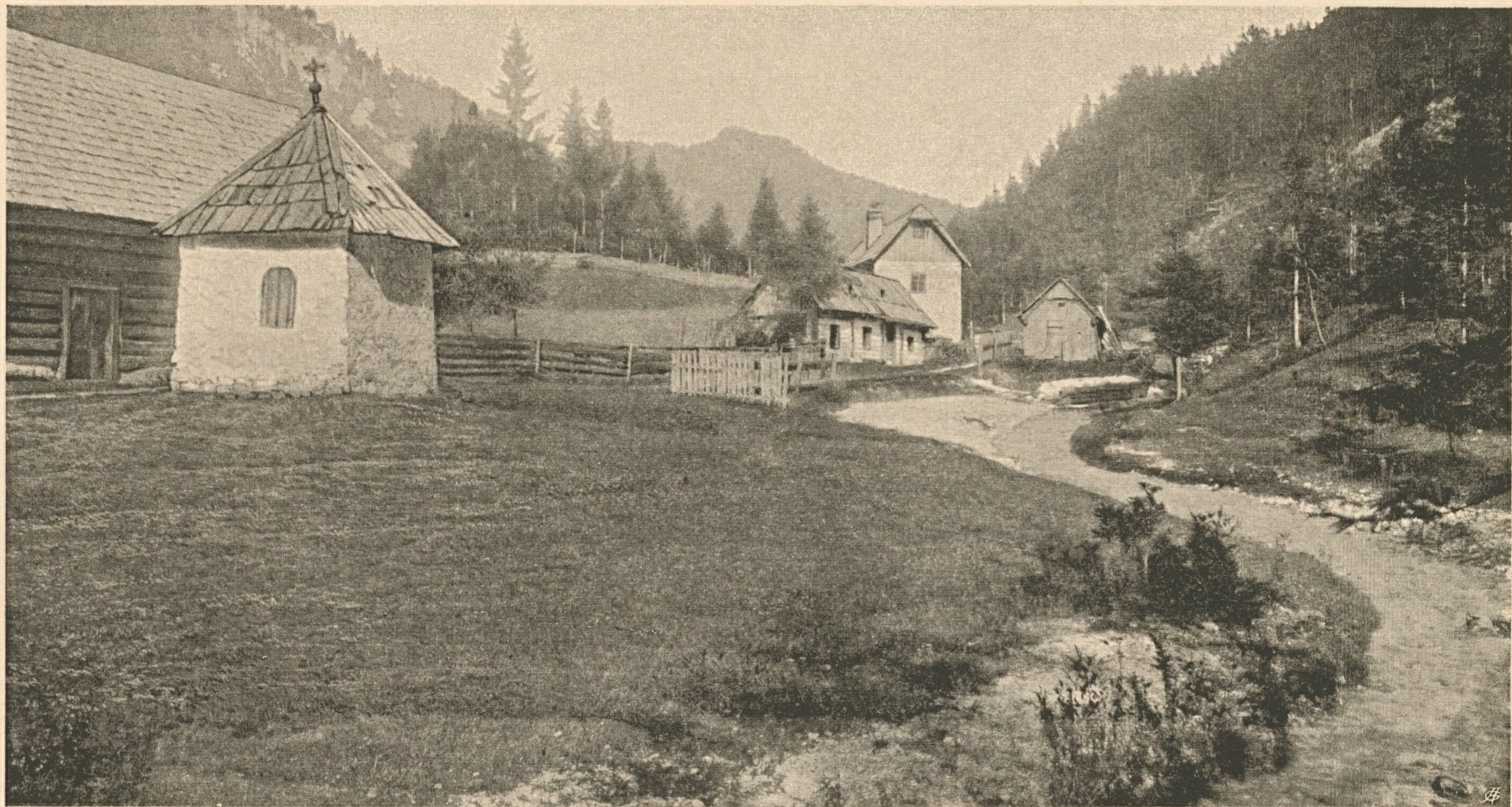
Nr. 21. Das Hopfgarten- tal bei Wildalpe.